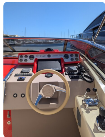
Sarnico Spider details