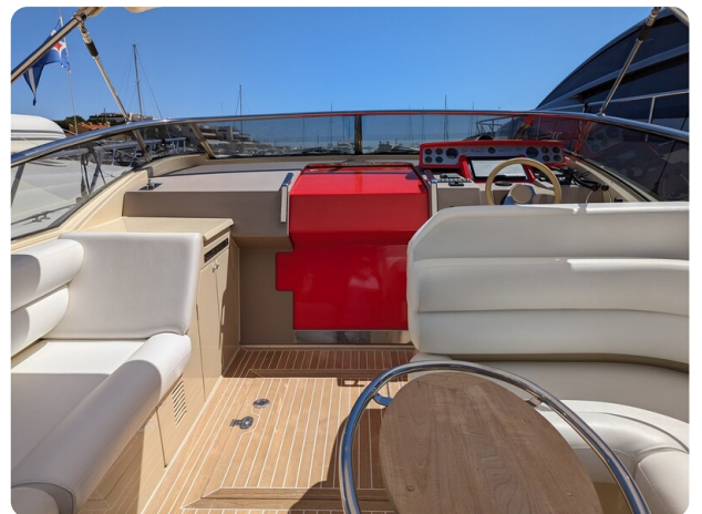
Sarnico Spider cockpit view too