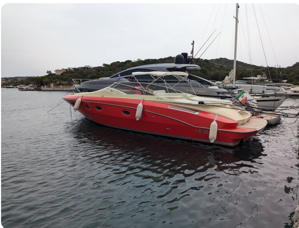
Sarnico Spider, profile