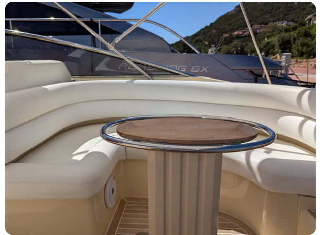
Sarnico Spider cockpit dinette