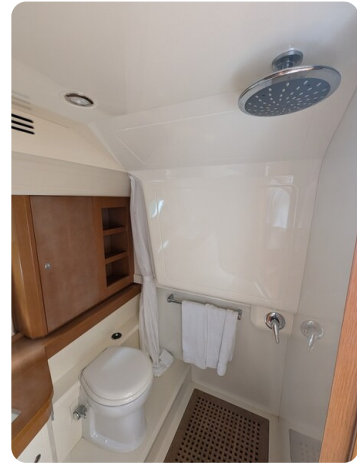
Sarnico Spider shower