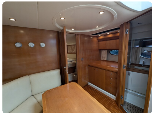
Sarnico Spider int details