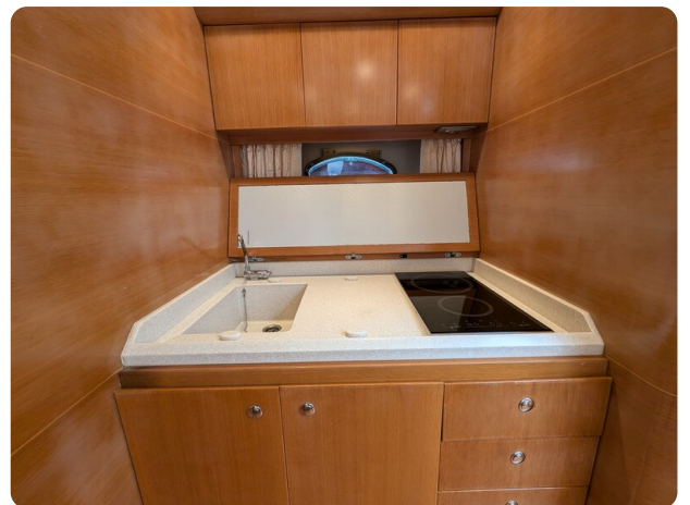
Sarnico Spider galley