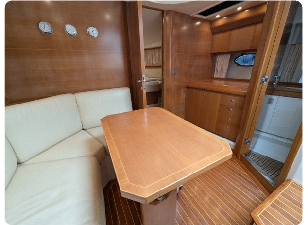
Sarnico Spider salon view