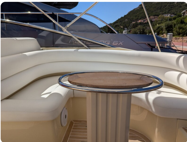
Sarnico Spider cockpit dinette