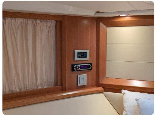
Sarnico Spider owner's cabin detail