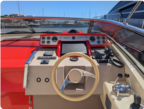
Sarnico Spider helm