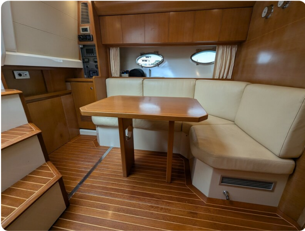
Sarnico Spider dinette