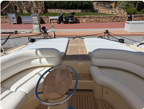
Sarnico Spider cockpit view