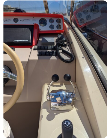
Sarnico Spider joystick