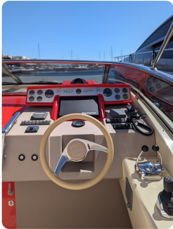
Sarnico Spider details