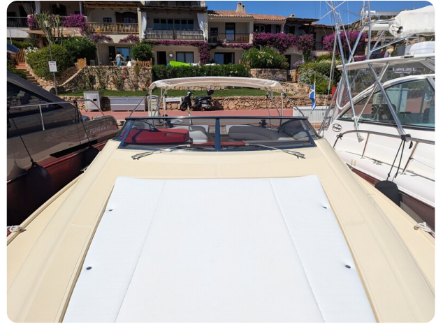
Sarnico Spider bow sunpad