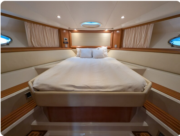
Sarnico Spider owner's cabin