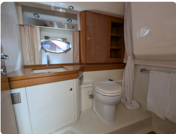
Sarnico Spider bathroom view