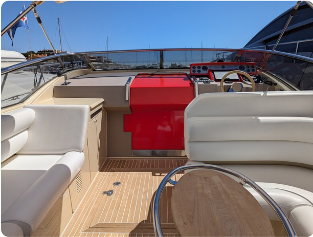
Sarnico Spider cockpit view too