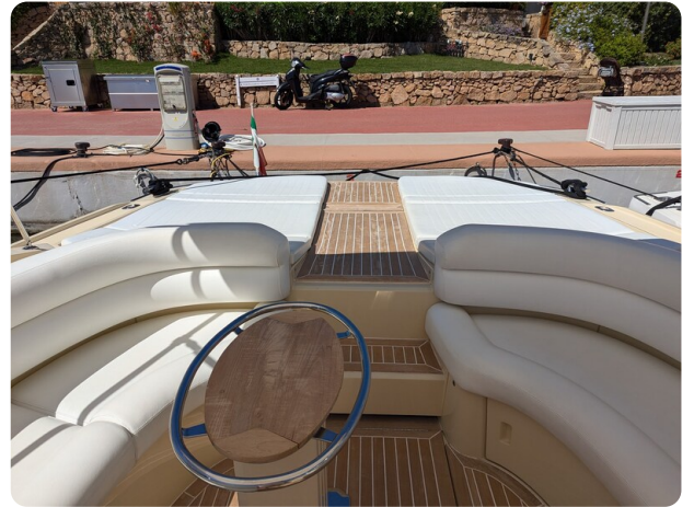
Sarnico Spider cockpit view