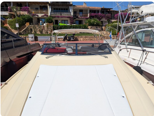
Sarnico Spider bow sunpad