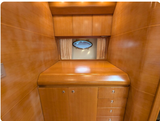
Sarnico Spider galley, closed