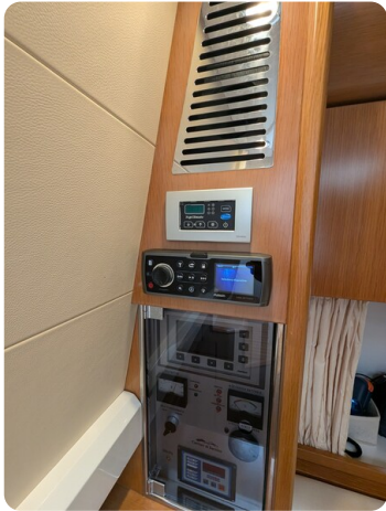
Sarnico Spider salon detail