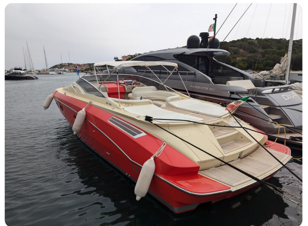
Sarnico Spider aft profile