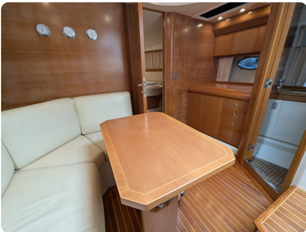
Sarnico Spider salon view