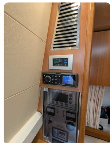
Sarnico Spider salon detail