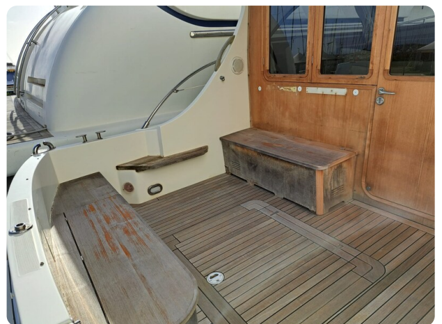
Goldstar 360 Pozzetto