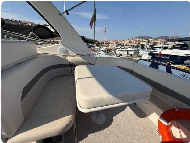
CHAPARRAL SIGNATURE 310 Dinette detail