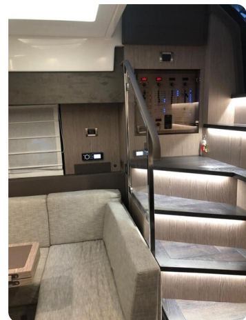
Cranchi 60 ST Stairs Detail.jpg