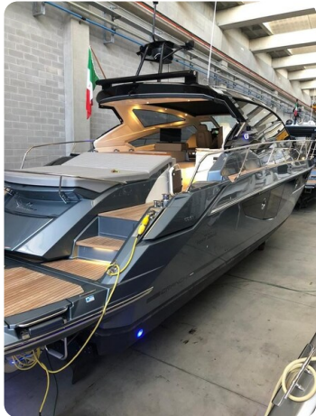
Cranchi 60 ST Aft Profile.jpg