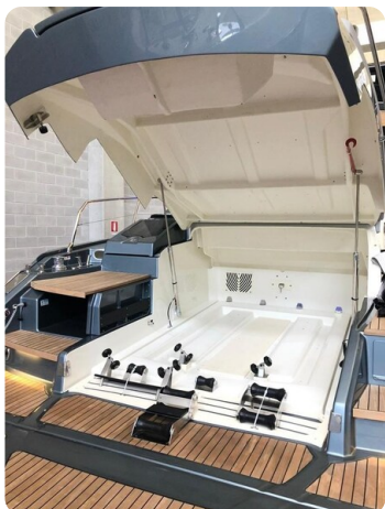
Cranchi 60 ST Garage.jpg