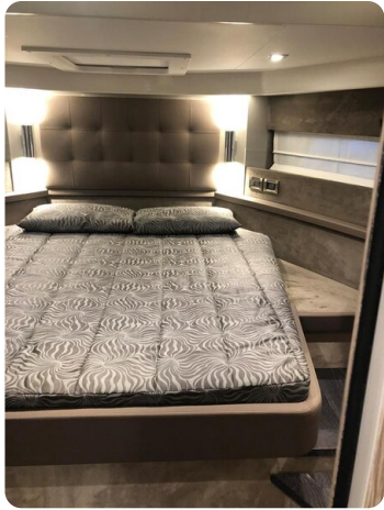
Cranchi 60 ST Owner's Cabin.jpg