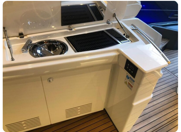
Cranchi 60 ST Main Deck Galley.jpg