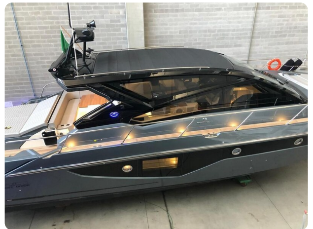
Cranchi 60 ST Hard Top View.jpg