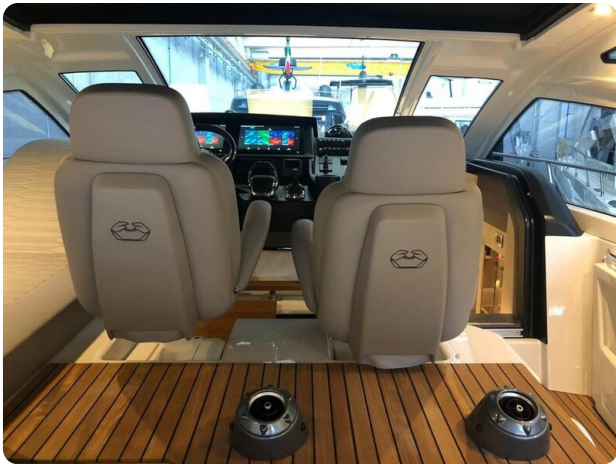
Cranchi 60 ST Helm Station.jpg