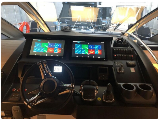
Cranchi 60 ST Helm Detail.jpg