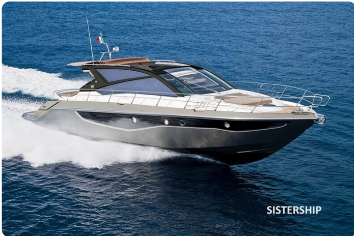
Cranchi 60 ST cruising