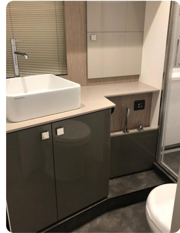
Cranchi 60 ST Bathroom.jpg