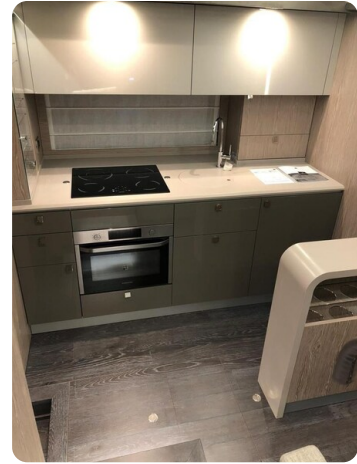
Cranchi 60 ST Lower Deck Galley.jpg