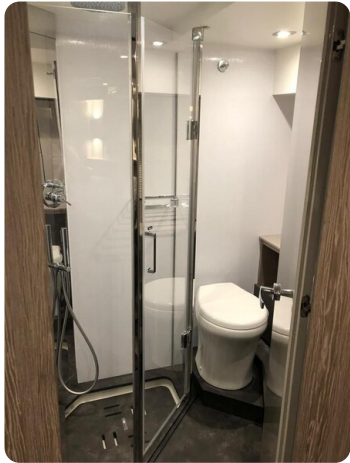
Cranchi 60 ST Bathroom.jpg