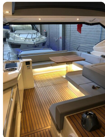
Cranchi 60 ST Cockpit Aft View.jpg