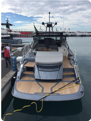
Cranchi 60 ST Stern View.jpg