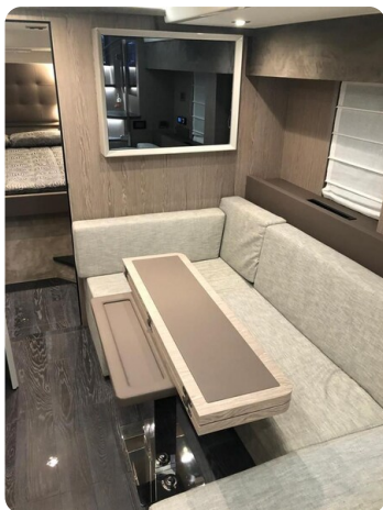
Cranchi 60 ST Lower Deck Dinette.jpg