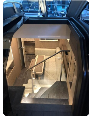
Cranchi 60 ST Dinette Top View.jpg