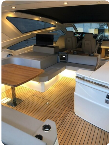
Cranchi 60 ST Cockpit.jpg