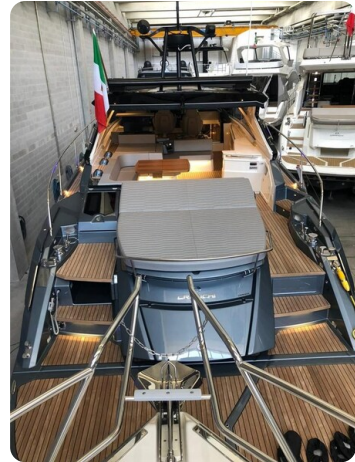
Cranchi 60 ST Aft Sunpad.jpg