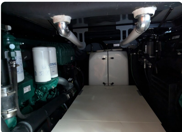
Cranchi 46 Luxury Tender engine room