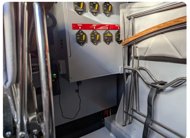
Cranchi 46 Luxury Tender detail