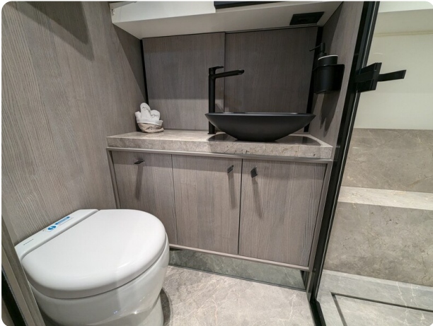
Cranchi 46 Luxury Tender bathroom