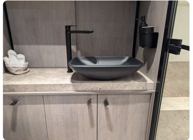
Cranchi 46 Luxury Tender bathroom detail