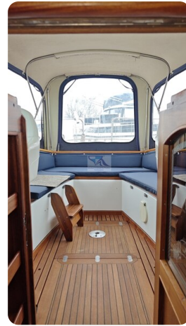
Spitzgatt Kutter LADY 61