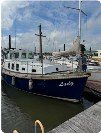
Spitzgatt Kutter Lady