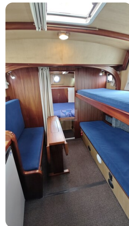
Spitzgatt Kutter LADY 70