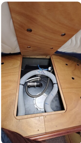
Spitzgatt Kutter LADY 94