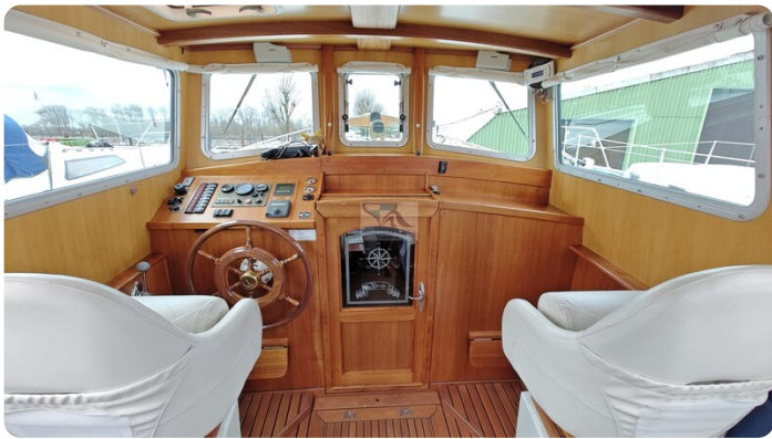
Spitzgatt Kutter LADY 28