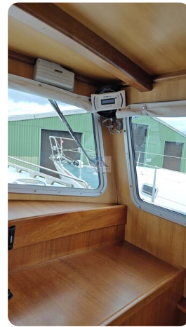
Spitzgatt Kutter LADY 30