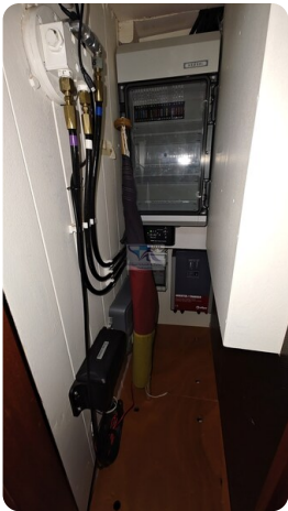
Spitzgatt Kutter LADY 58