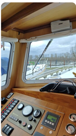
Spitzgatt Kutter LADY 32