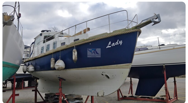
Spitzgatt Kutter LADY 7