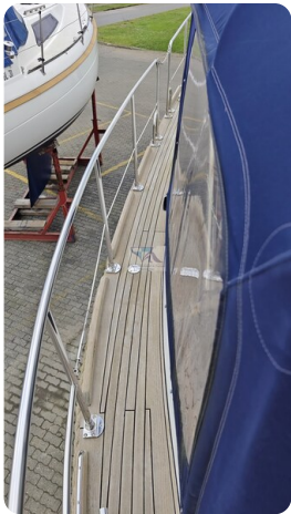
Spitzgatt Kutter LADY 9