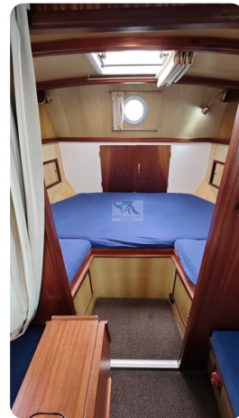
Spitzgatt Kutter LADY 84