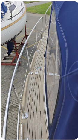
Spitzgatt Kutter LADY 9