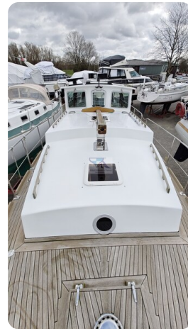
Spitzgatt Kutter LADY 18