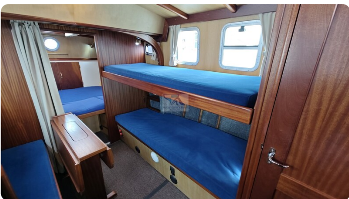
Spitzgatt Kutter LADY 67