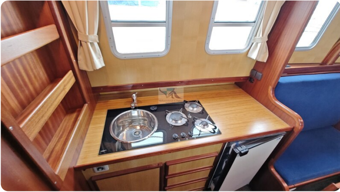
Spitzgatt Kutter LADY 72