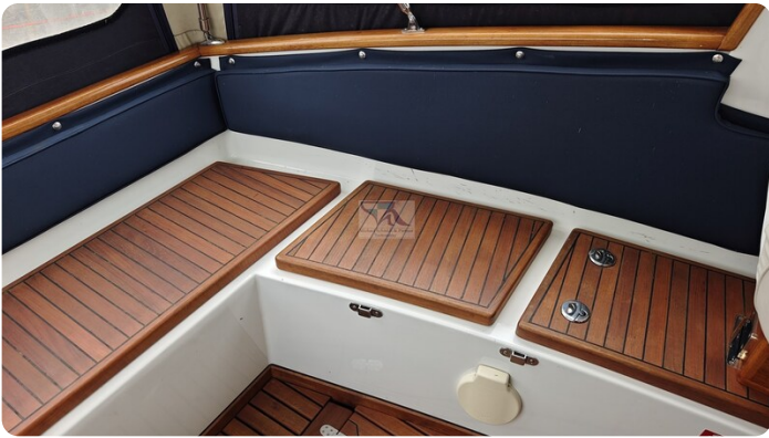
Spitzgatt Kutter LADY 56