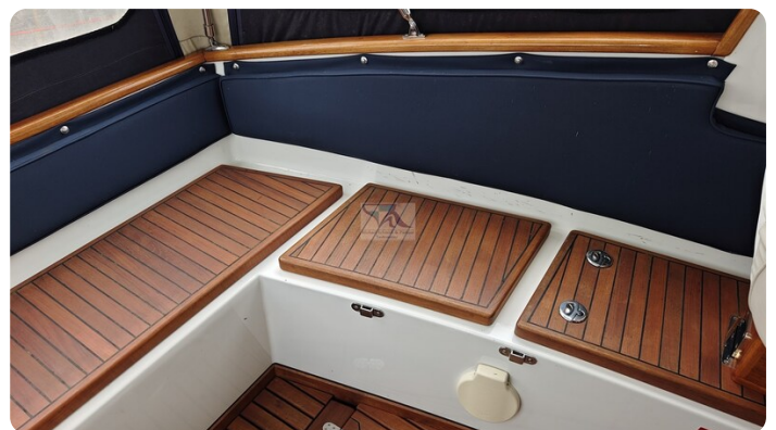
Spitzgatt Kutter LADY 56