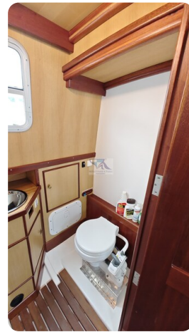
Spitzgatt Kutter LADY 66