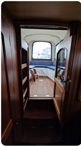
Spitzgatt Kutter LADY 63