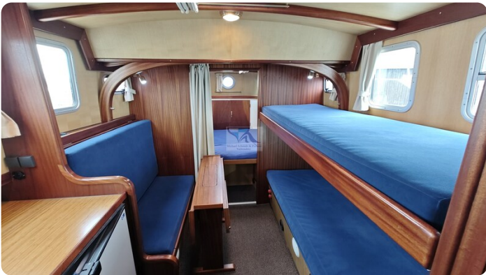
Spitzgatt Kutter LADY 78