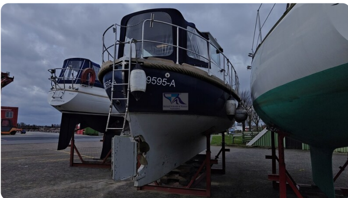
Spitzgatt Kutter LADY 1