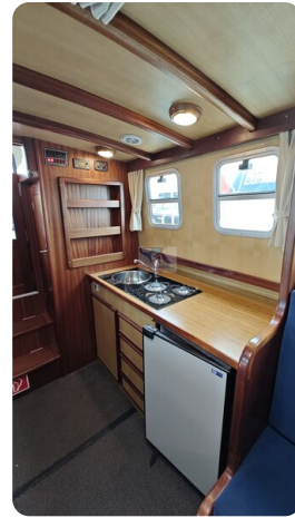
Spitzgatt Kutter LADY 74