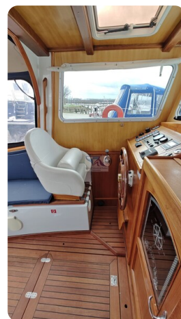
Spitzgatt Kutter LADY 35