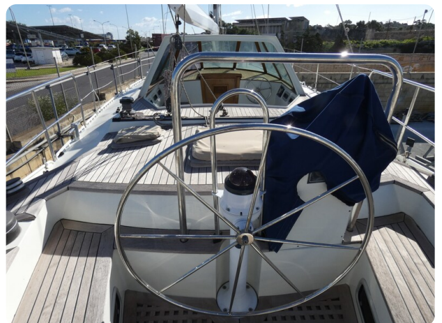
Van de Stadt 51 msp548133 6