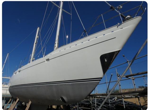
Van de Stadt 51 msp548133 4