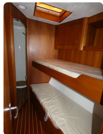
Van de Stadt 51 msp548133 18