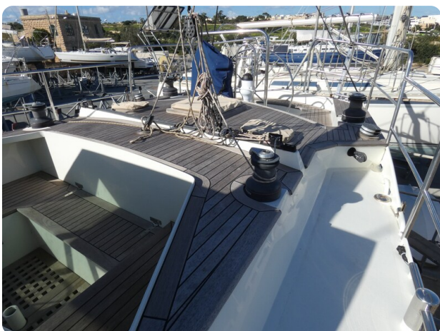
Van de Stadt 51 msp548133 11