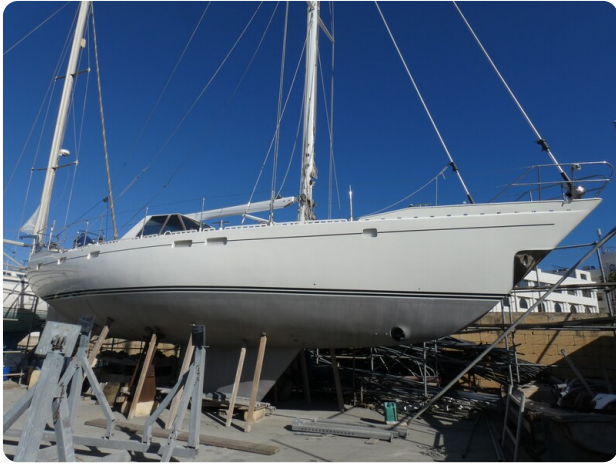
Van de Stadt 51 msp548133 1