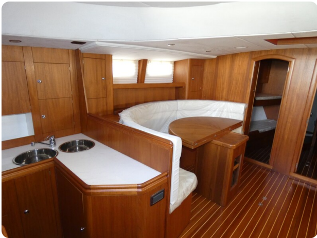
Van de Stadt 51 msp548133 13