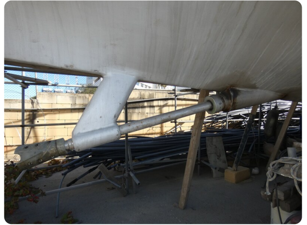
Van de Stadt 51 msp548133 2