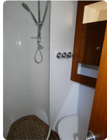
Van de Stadt 51 msp548133 22