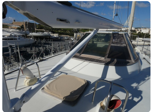
Van de Stadt 51 msp548133 10