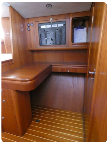
Van de Stadt 51 msp548133 23