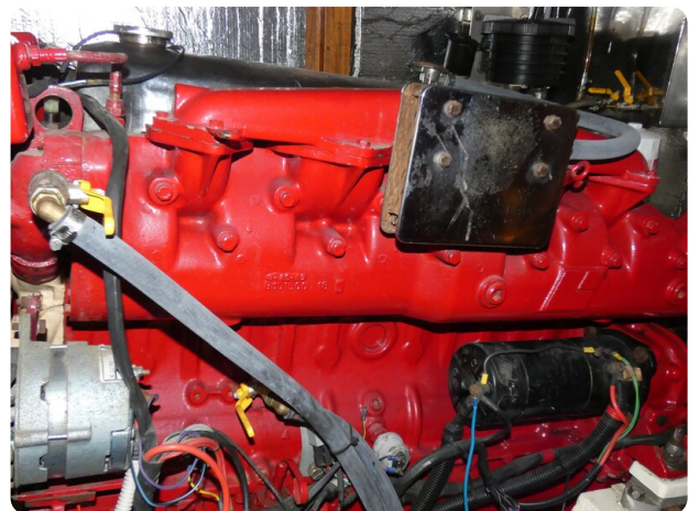
Van de Stadt 51 msp548133 24