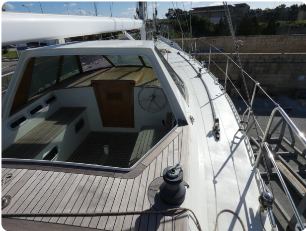
Van de Stadt 51 msp548133 7