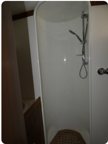
Van de Stadt 51 msp548133 19