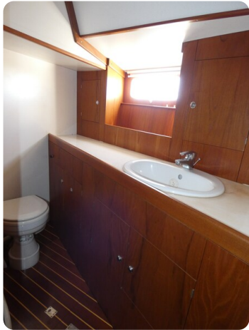
Van de Stadt 51 msp548133 21