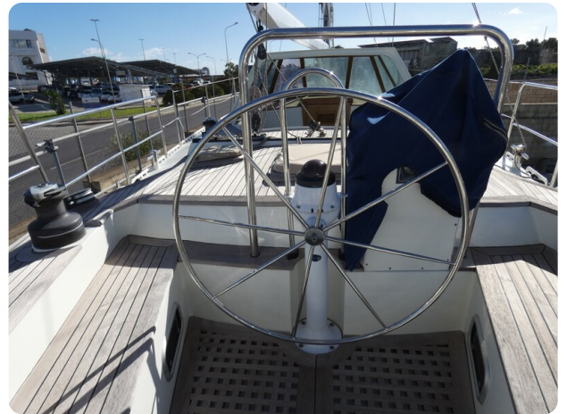
Van de Stadt 51 msp548133 8