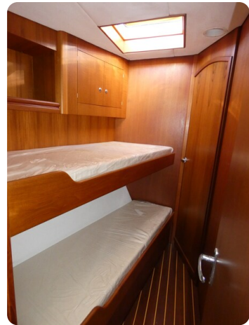
Van de Stadt 51 msp548133 20