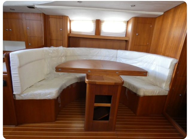
Van de Stadt 51 msp548133 14