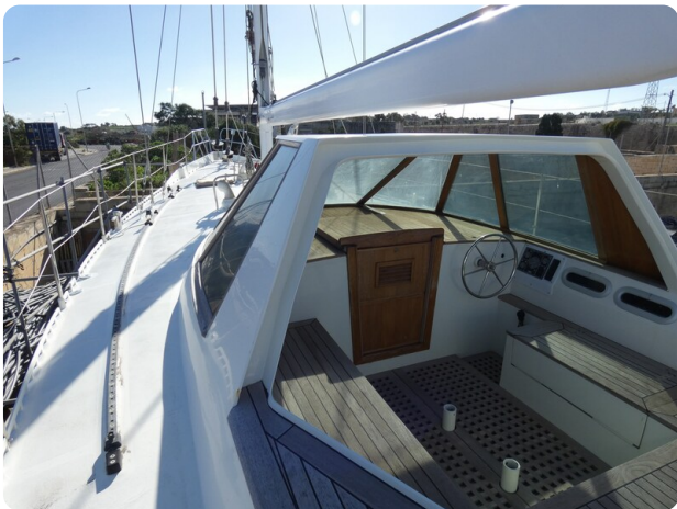
Van de Stadt 51 msp548133 9