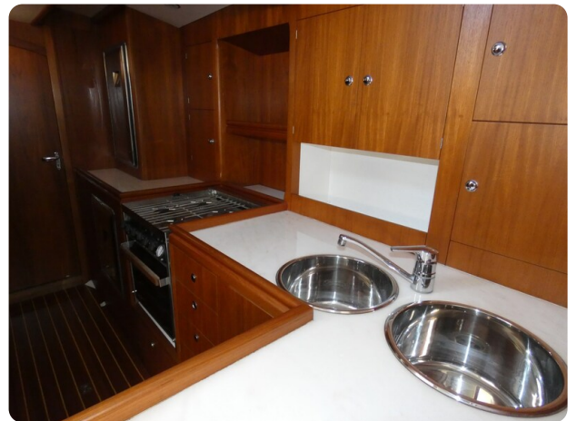
Van de Stadt 51 msp548133 16