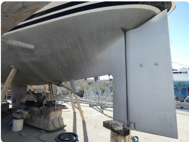
Van de Stadt 51 msp548133 3