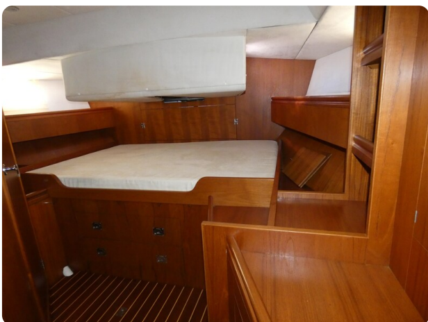
Van de Stadt 51 msp548133 17