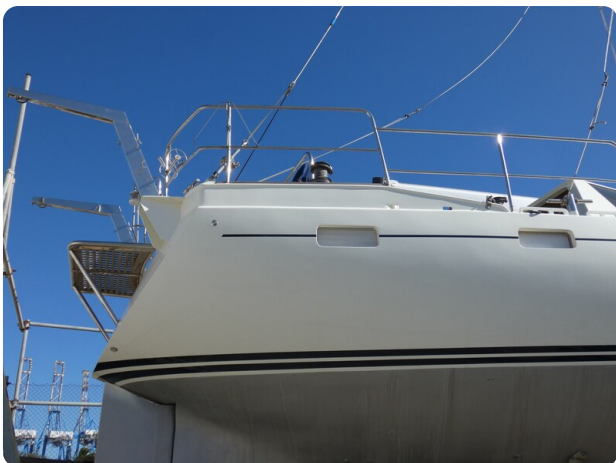
Van de Stadt 51 msp548133 5