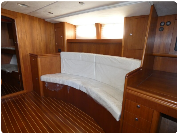
Van de Stadt 51 msp548133 15