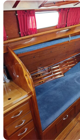
6 KR De Dood 47