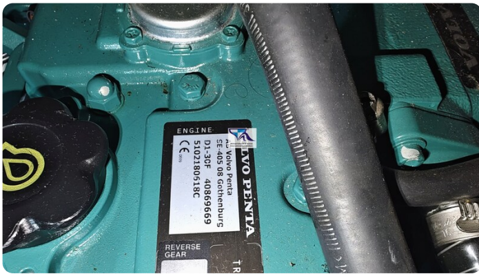
Marken II_msp797539 121