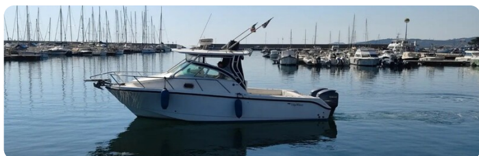
Edge water 265 express