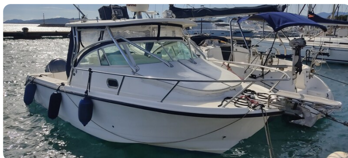
Edge Water 265 ex-1