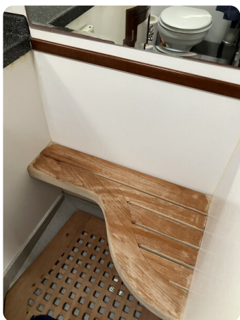
Liberty 35 Shower