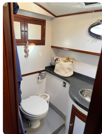
Liberty 35 head