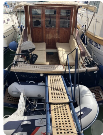
Liberty 35 Stern View