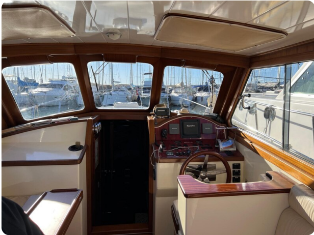
Liberty 35 helm station