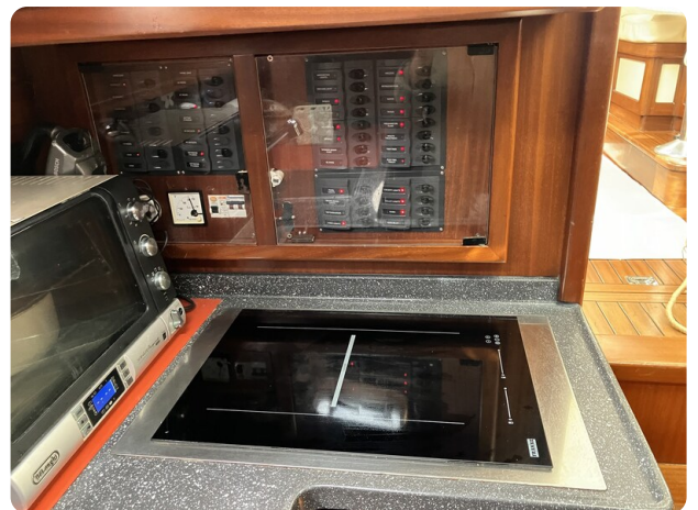
Liberty 35 Cockpit Galley Detail