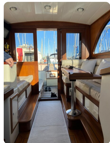
Liberty 35 salon