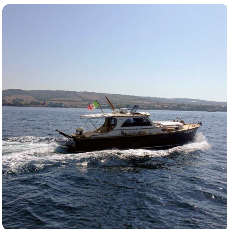
Liberty 35 Profile