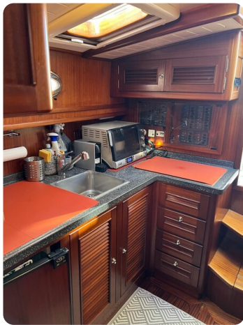
Liberty 35 galley overview