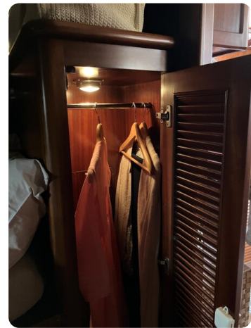
Liberty 35 interiors