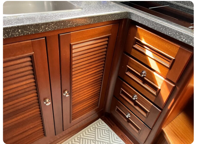
Liberty 35 galley detail