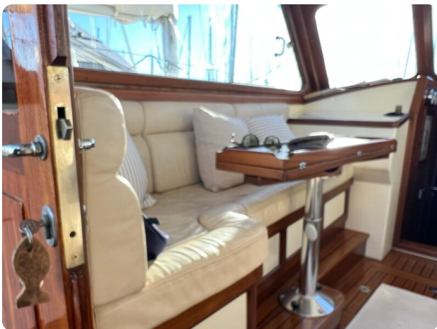
Liberty 35 dinette