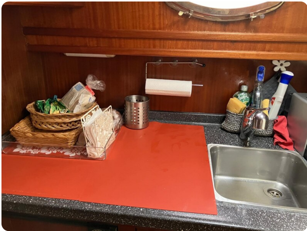
Liberty 35 galley