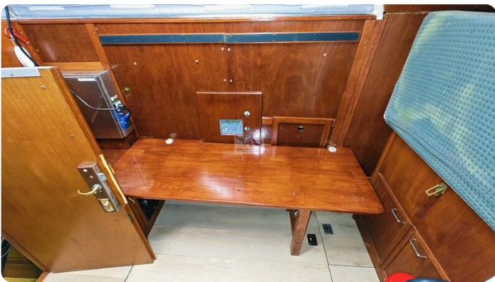
Reinke Tourina 10m_62