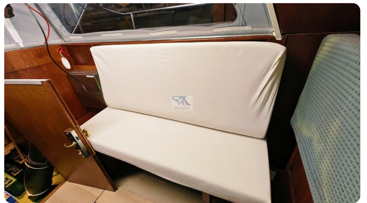
Reinke Tourina 10m_64