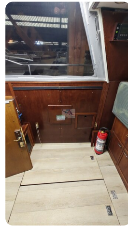
Reinke Tourina 10m_47