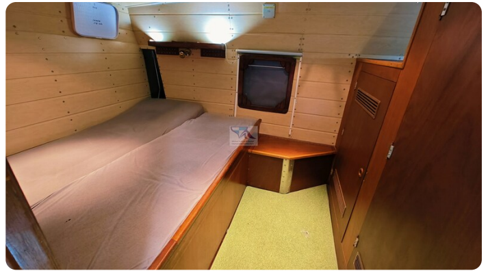
Reinke Tourina 10m_75