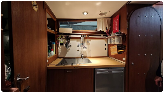
Reinke Tourina 10m_8