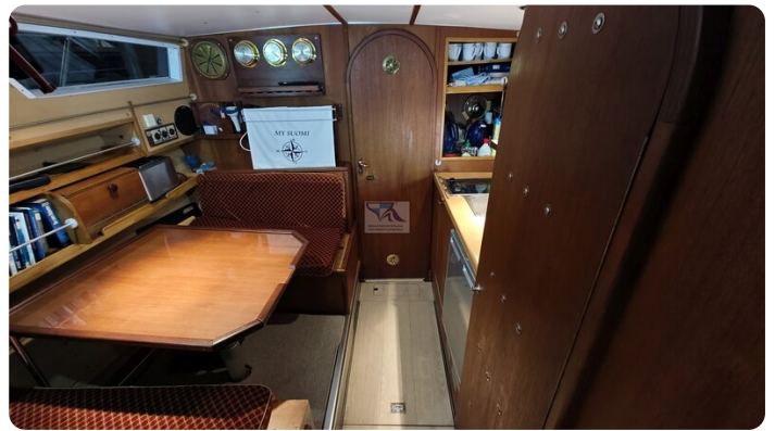
Reinke Tourina 10m_34