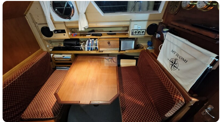
Reinke Tourina 10m_12