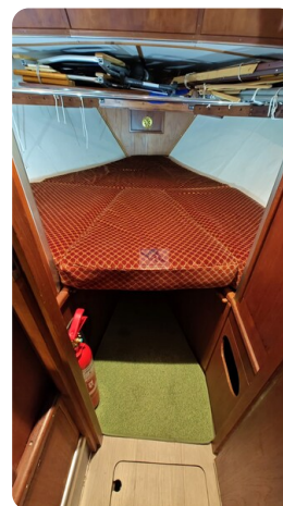
Reinke Tourina 10m_5