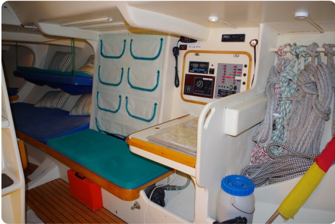
MSP_5276 - Kopie