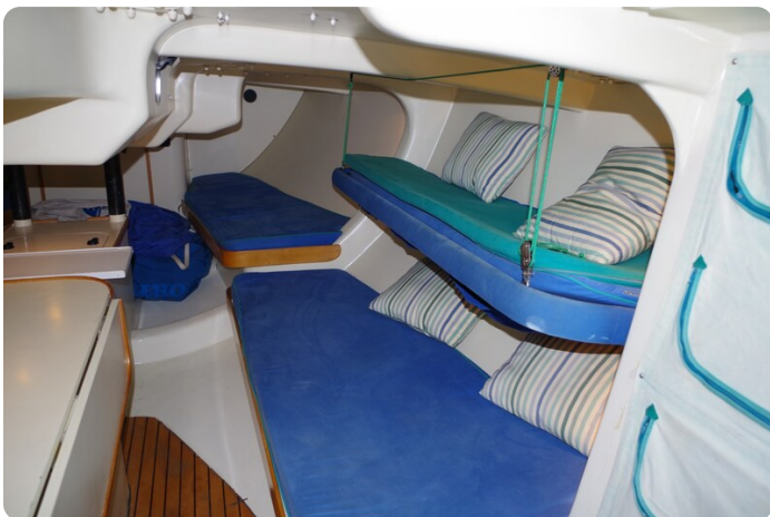
MSP_5271 - Kopie