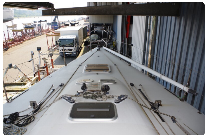
MSP_5245 - Kopie