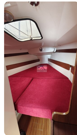
Etap 23i 1