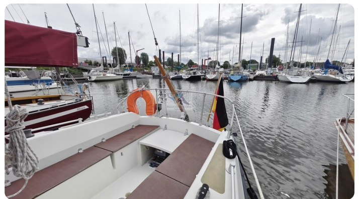
Etap 23i 26