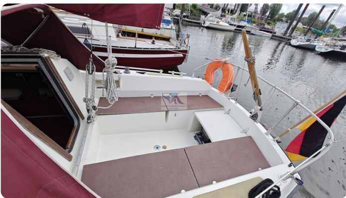
Etap 23i 25