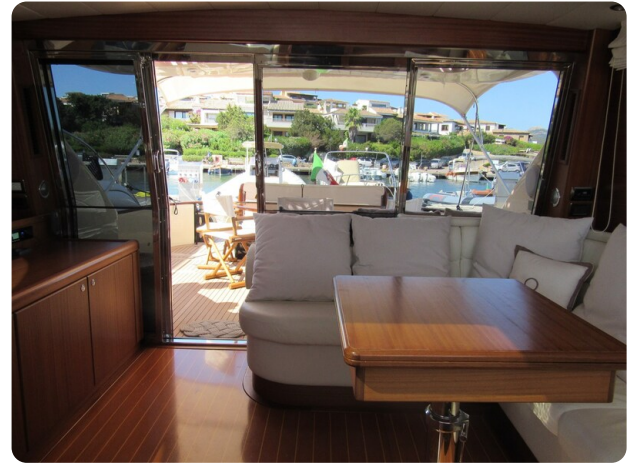
Franchini 55 Emozione, salon to aft