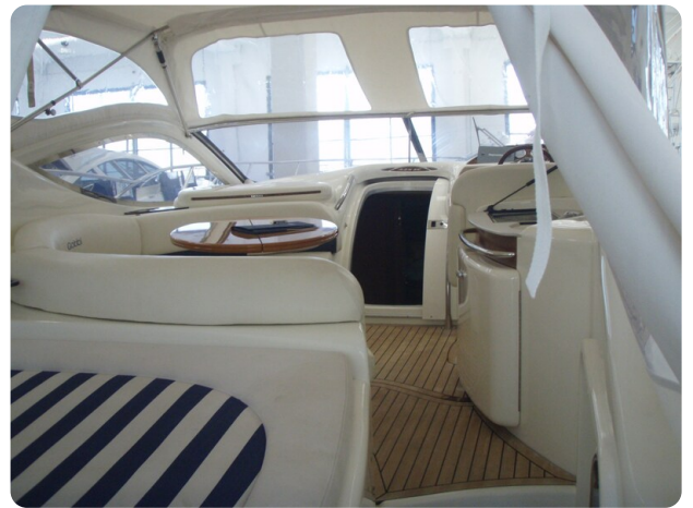
Gobbi 425 esterno