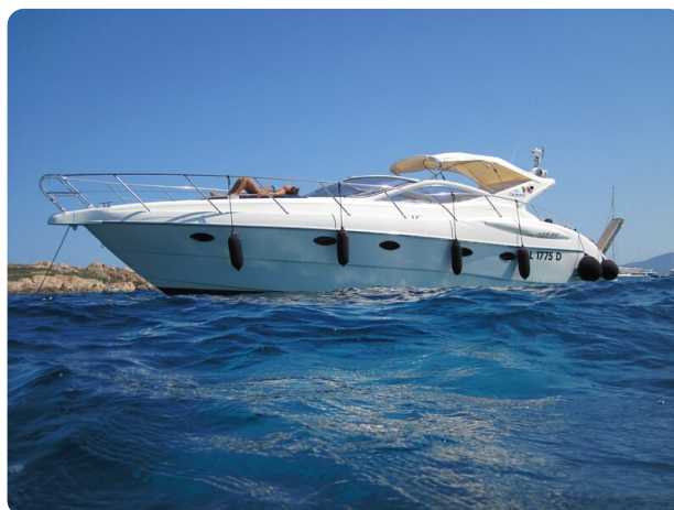
Gobbi 425 esterno (2)