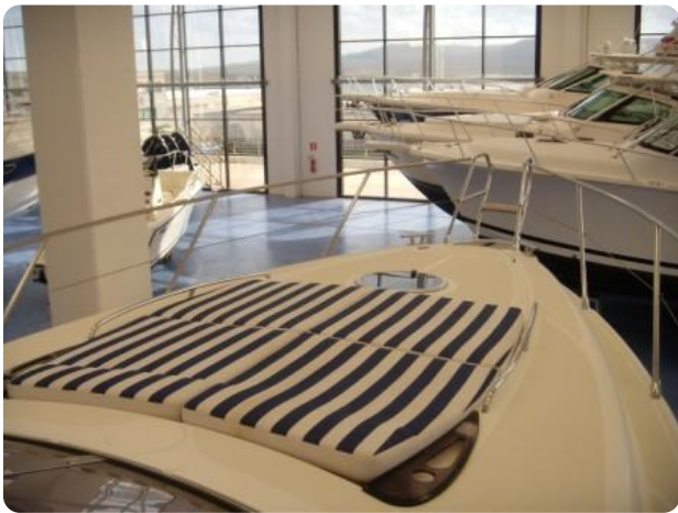
Gobbi 425 esterno (10)