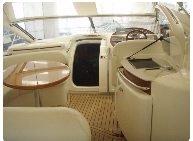
Gobbi 425 interno