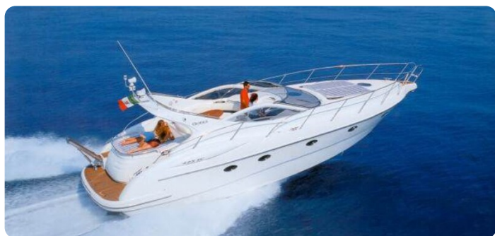
Gobbi sister ship