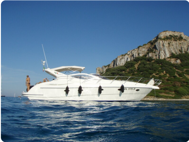
Gobbi 425 esterno (1)