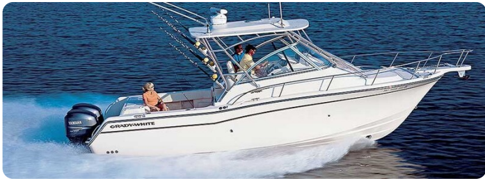
Grady White 305 express sistership