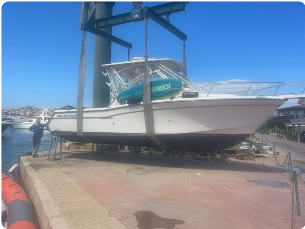
Grady White 305 express