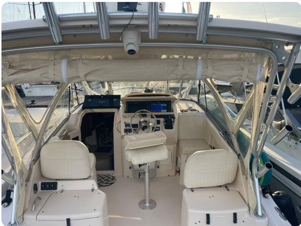
Grady White 305 express