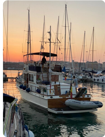
Grand Banks 42 sunset