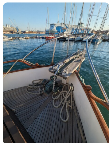
Grand Banks 42 Classic bow pulpit