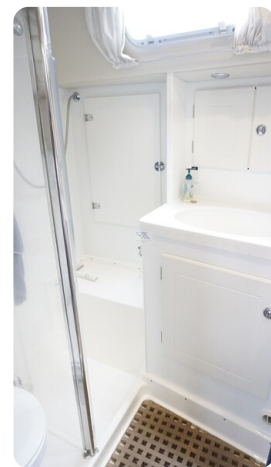
Hallberg Rassy 48 AURORA 34