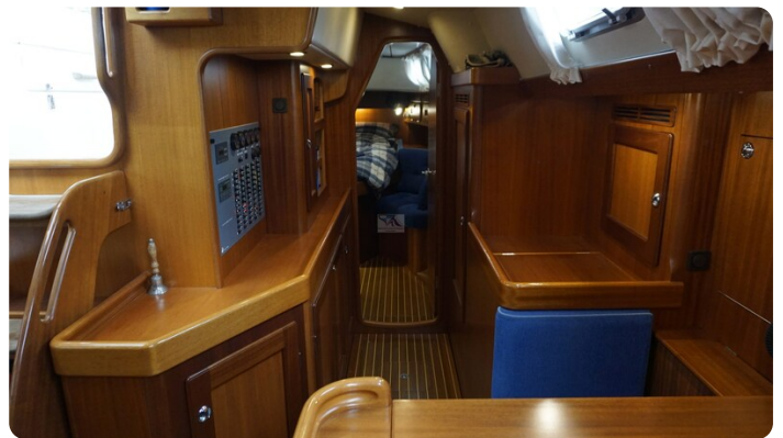
Hallberg Rassy 48 AURORA 28