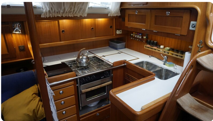
Hallberg Rassy 48 AURORA 23