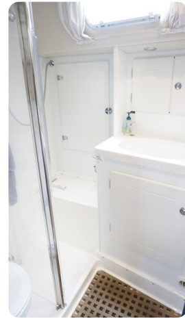
Hallberg Rassy 48 AURORA 34