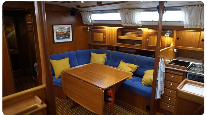
Hallberg Rassy 48 AURORA 51