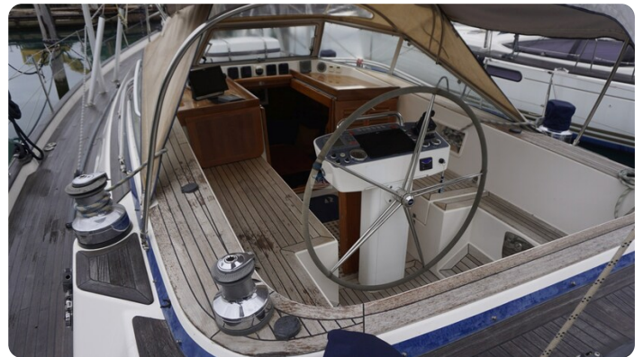
Hallberg Rassy 48 AURORA 65