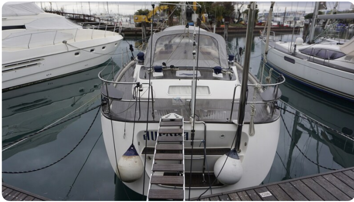
Hallberg Rassy 48 AURORA 3