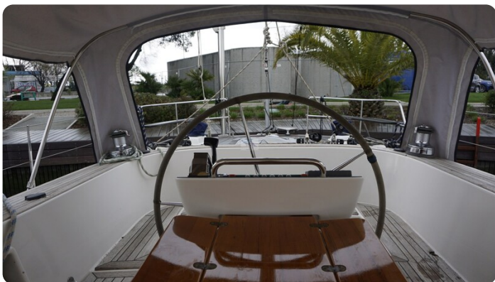
Hallberg Rassy 48 AURORA 19