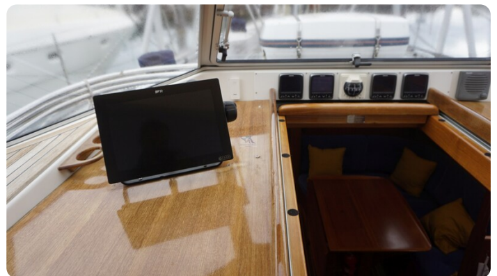
Hallberg Rassy 48 AURORA 67