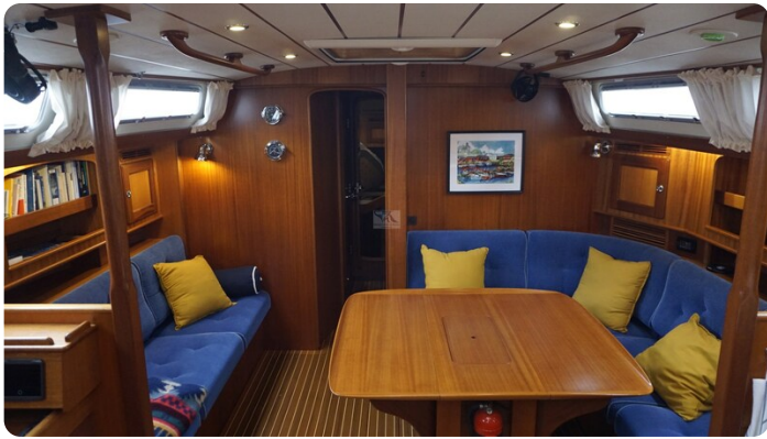
Hallberg Rassy 48 AURORA 20