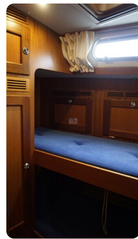
Hallberg Rassy 48 AURORA 42