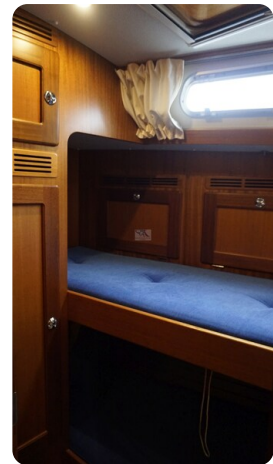
Hallberg Rassy 48 AURORA 42