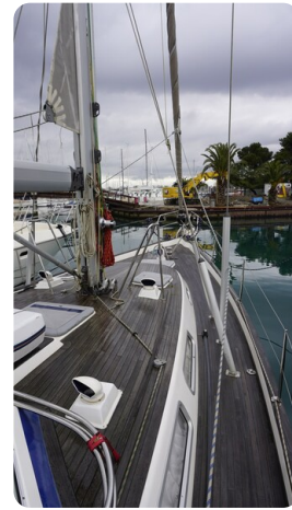
Hallberg Rassy 48 AURORA 5