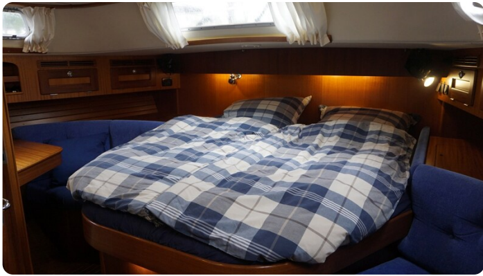
Hallberg Rassy 48 AURORA 31