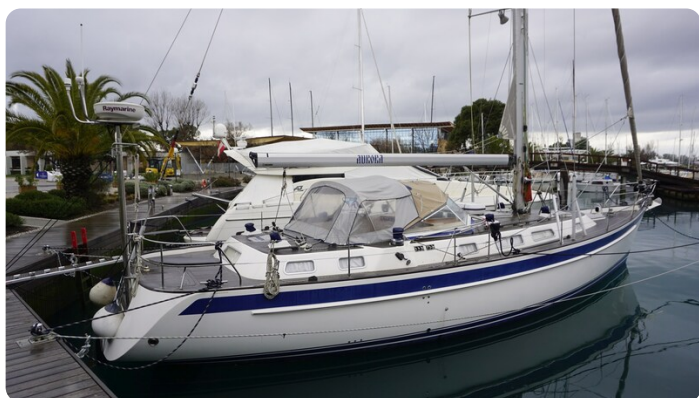
Hallberg Rassy 48 AURORA 1