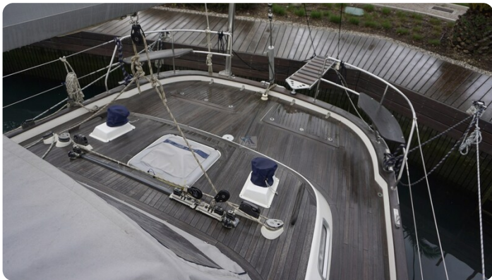
Hallberg Rassy 48 AURORA 11