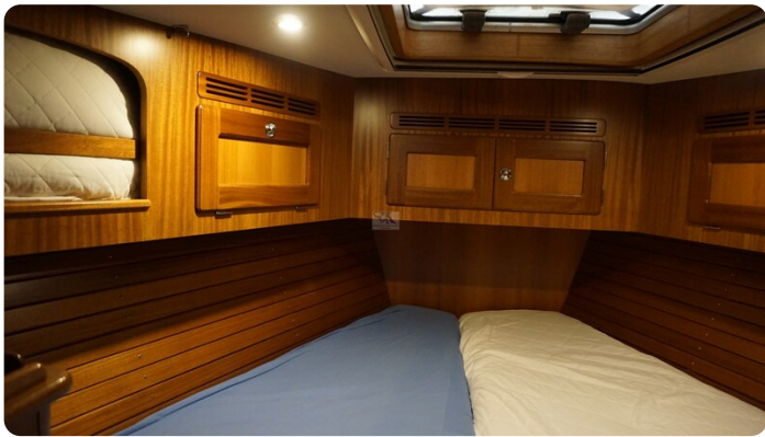
Hallberg Rassy 48 AURORA 39