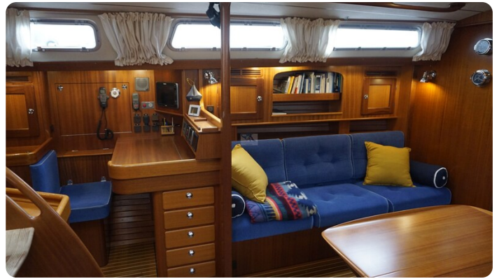
Hallberg Rassy 48 AURORA 26