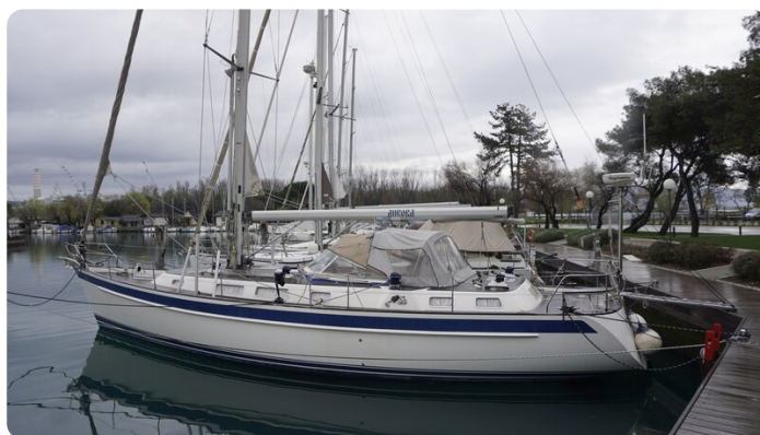
Hallberg Rassy 48 AURORA 2