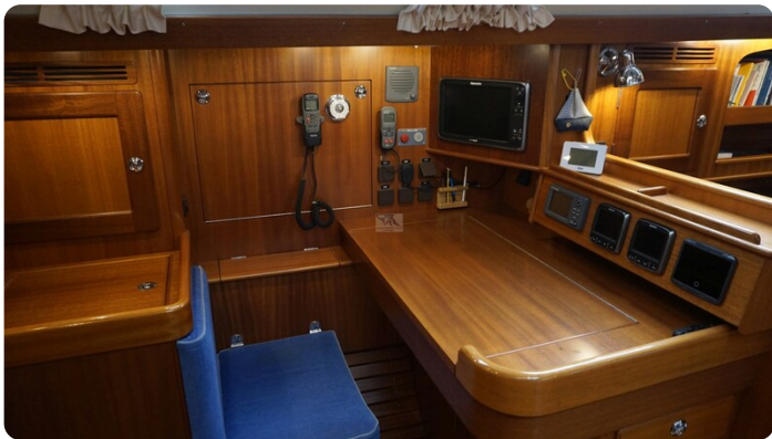
Hallberg Rassy 48 AURORA 27