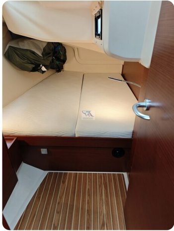
Hanse 418 EDGE 41