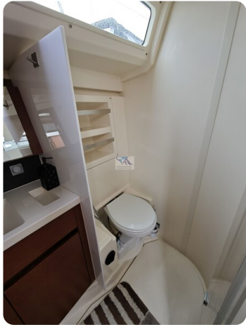
Hanse 418 EDGE 52