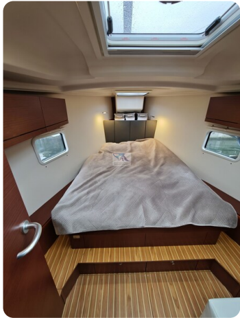
Hanse 418 EDGE 16