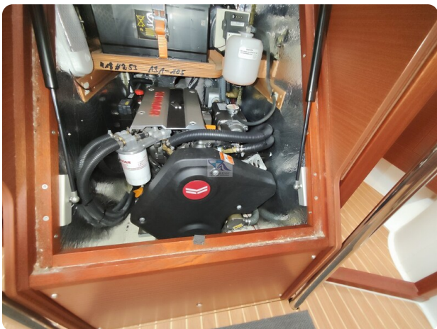
Hanse 418 EDGE 63