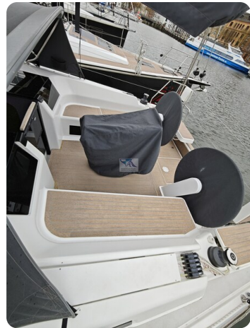
Hanse 418 EDGE 12