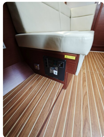
Hanse 418 EDGE 31