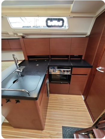
Hanse 418 EDGE 38