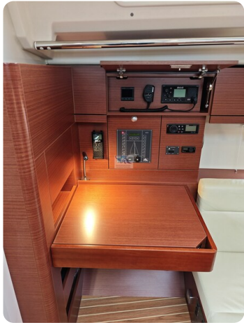
Hanse 418 EDGE 26