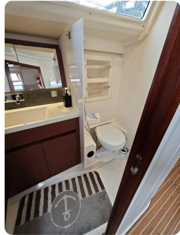
Hanse 418 EDGE 55