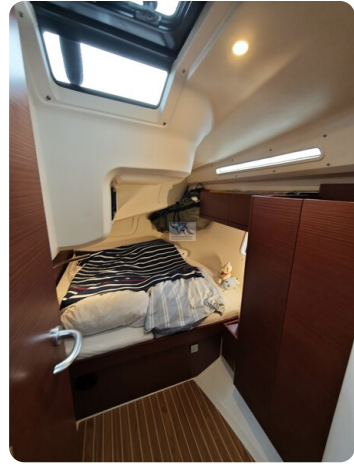
Hanse 418 EDGE 61