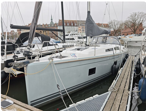
Hanse 418 EDGE 2