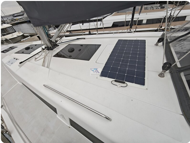
Hanse 418 EDGE 11