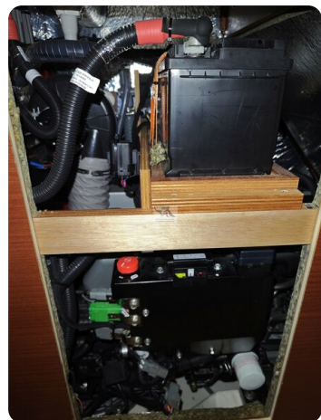
Hanse 418 EDGE 45