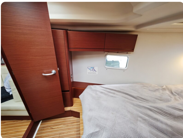
Hanse 418 EDGE 18