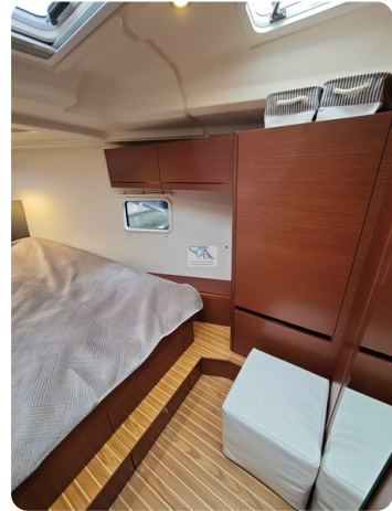
Hanse 418 EDGE 17