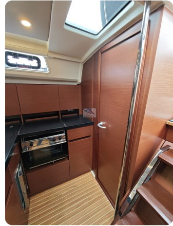
Hanse 418 EDGE 39