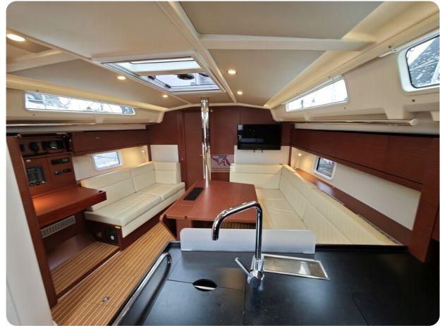
Hanse 418 EDGE 29