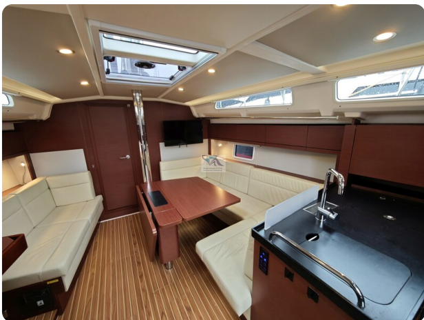
Hanse 418 EDGE 37