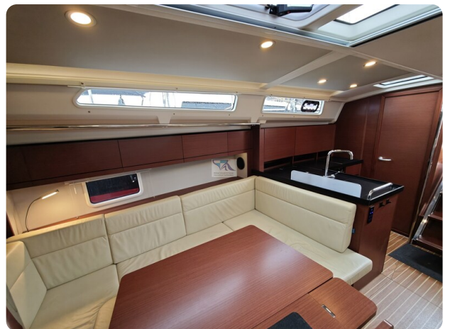
Hanse 418 EDGE 33