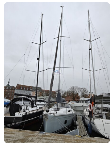
Hanse 418 EDGE 5