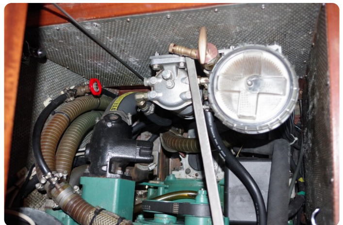
Hatecke 42 660249 125