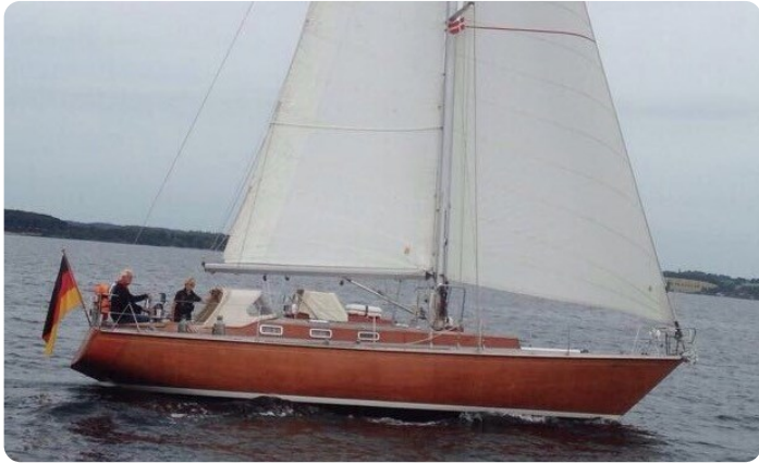
Hatecke 42 MELLUM