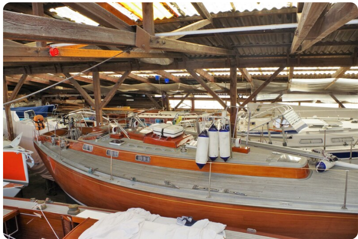
Hatecke 42 660249 133-1