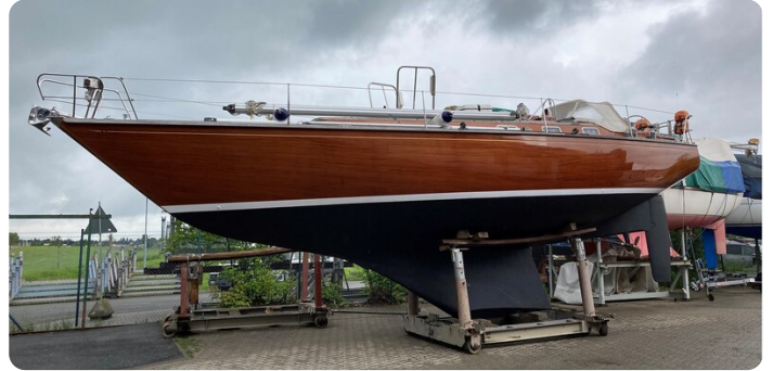
Hatecke 42 660249 1a