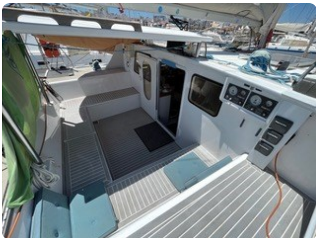
40 Cockpit Übersicht