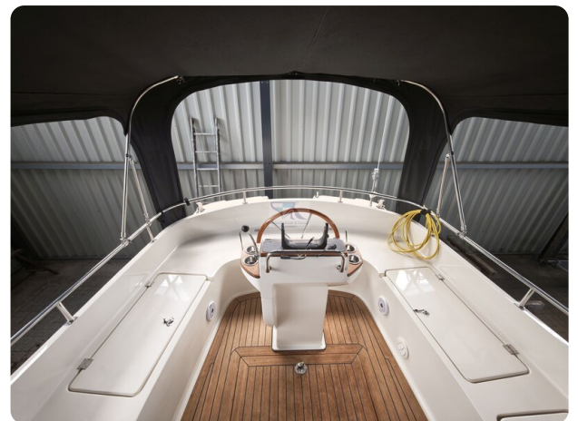
Inter cruiser 28 Cabrio ELVIRA 16