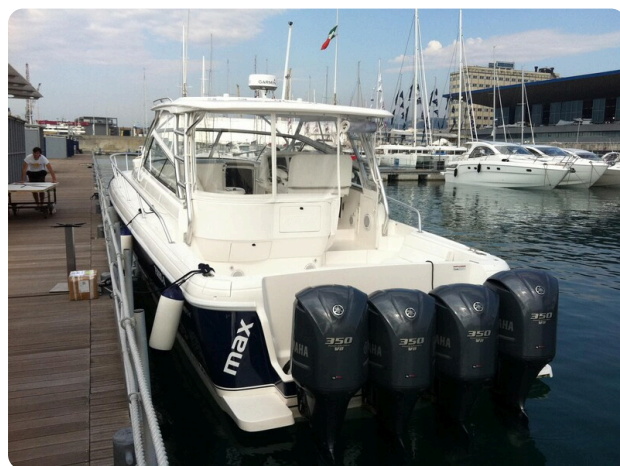
Intrepid 475 SY stern view