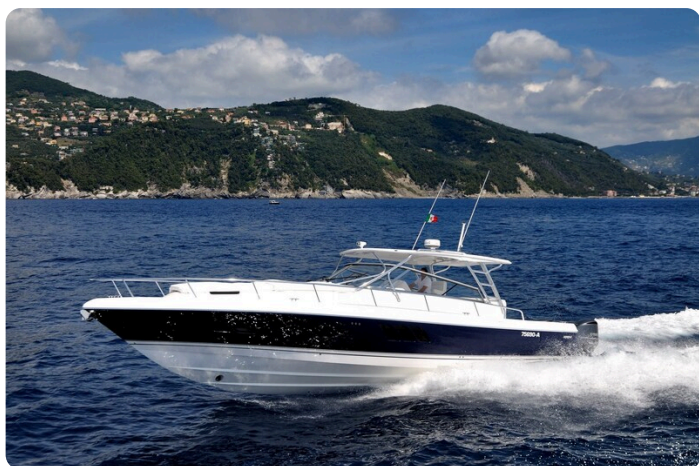
Intrepid 475 SY running