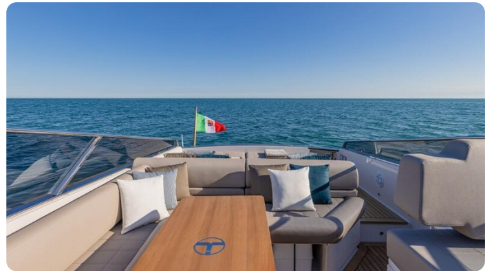
Itama 45RS cockpit dinette