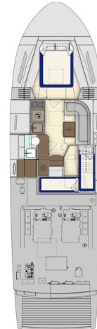
Itama 45RS lower layout