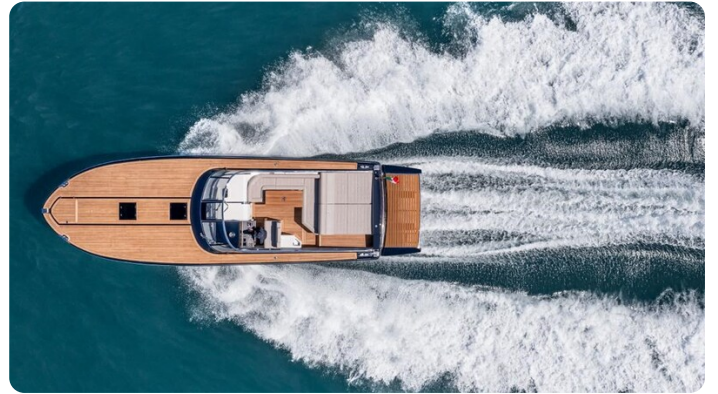
Itama 45RS running