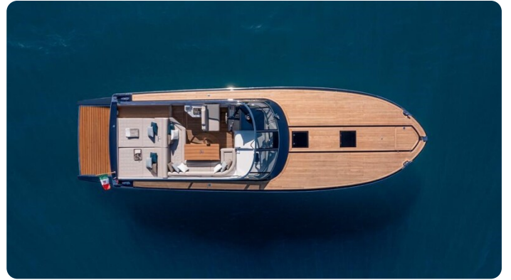
Itama 45RS aerial