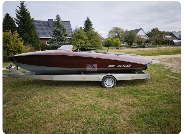
Kaiser 650 Super Sport 1