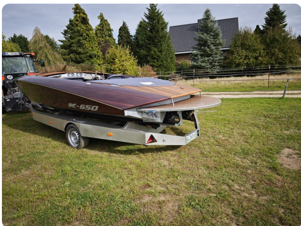
Kaiser 650 Super Sport 34