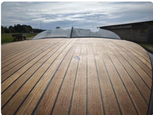
Kaiser 650 Super Sport 38