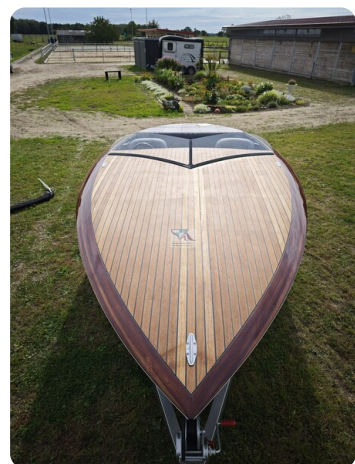
Kaiser 650 Super Sport 39