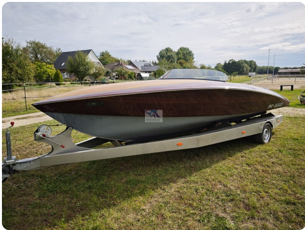
Kaiser 650 Super Sport 37