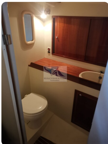
Kiel Legend 28 21