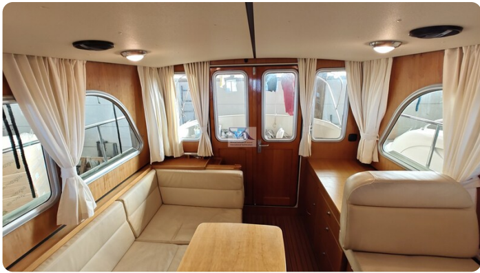
Linssen Grand Sturdy 29.9 24