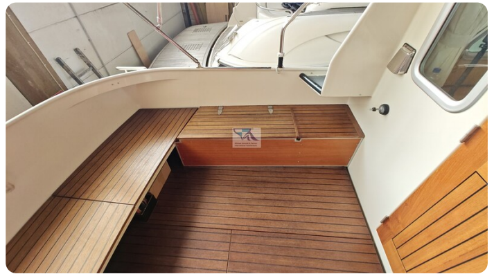
Linssen Grand Sturdy 29.9 53