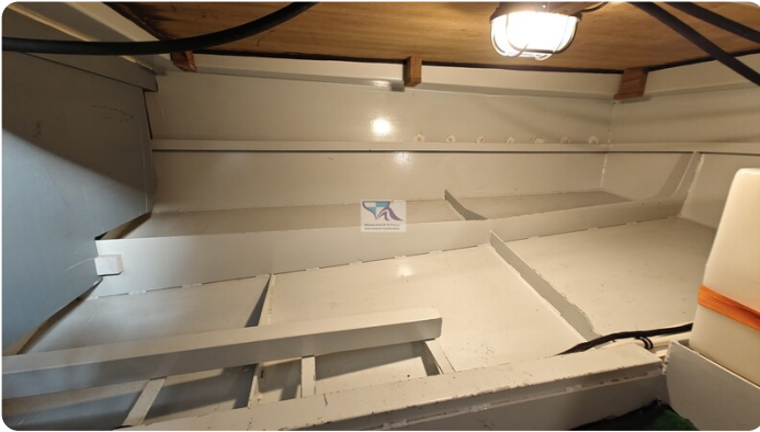
Linssen Grand Sturdy 29.9 58