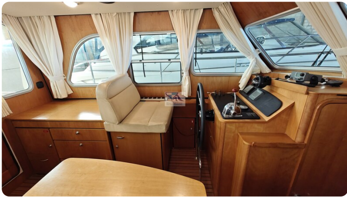
Linssen Grand Sturdy 29.9 26