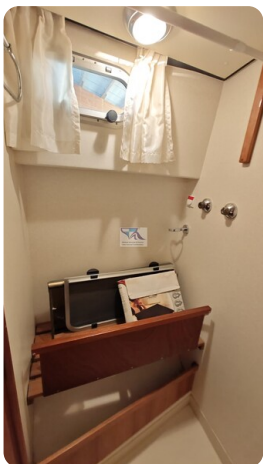
Linssen Grand Sturdy 29.9 51