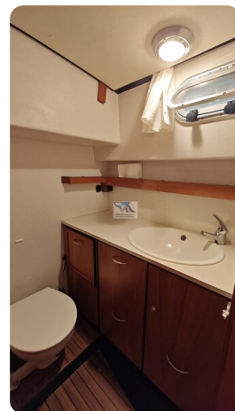
Linssen Grand Sturdy 29.9 47