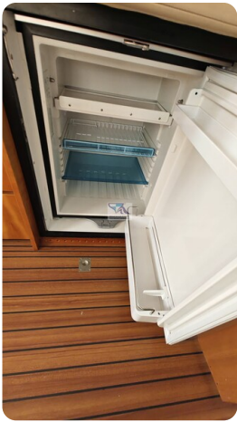
Linssen Grand Sturdy 29.9 15