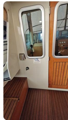
Linssen Grand Sturdy 29.9 56