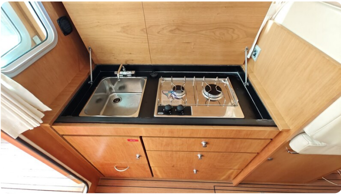
Linssen Grand Sturdy 29.9 16