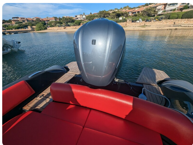
Lomac Adrenalina 7.5 stern view