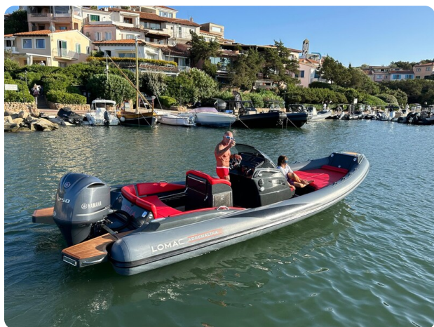
Lomac 7.50 Adrenalina aft view