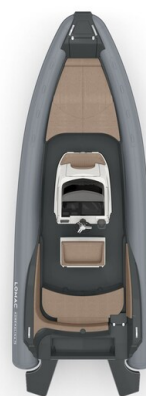
Lomac Adrenalina 7.5 layout