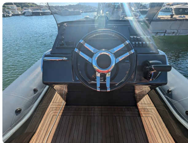
Lomac Adrenalina 7.5 helm