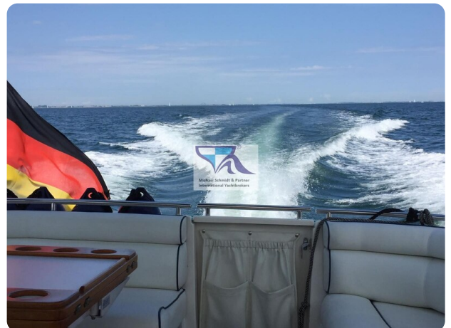
Marex 290 12