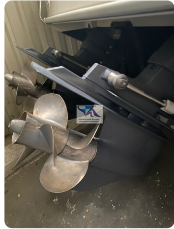
Marex 290 16