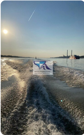
Marex 290 15