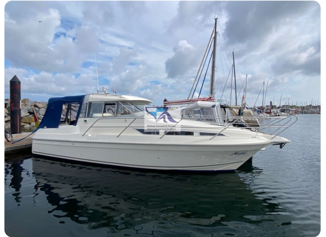
Marex 290 17