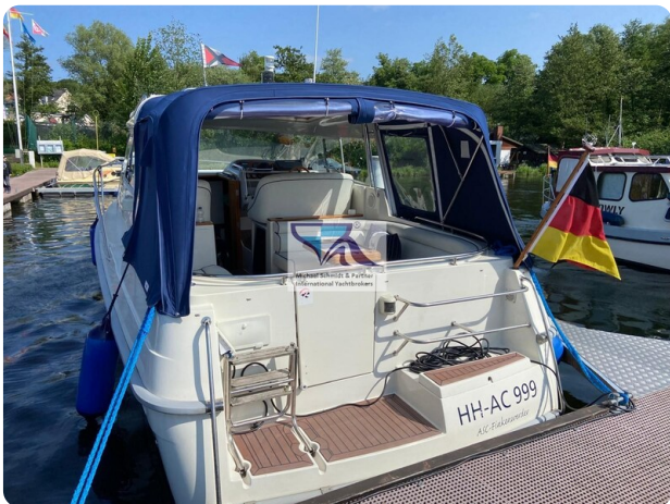
Marex 290 10