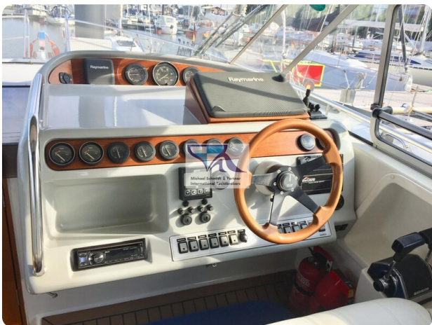
Marex 290 3