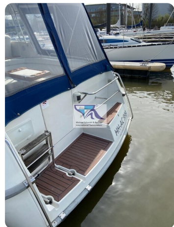
Marex 290 6