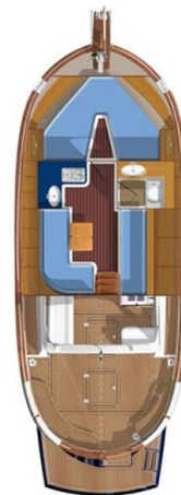
Menorquin 55T layout