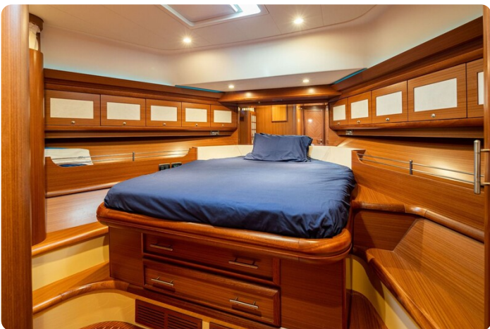
Dolphin 51 Vip cabin