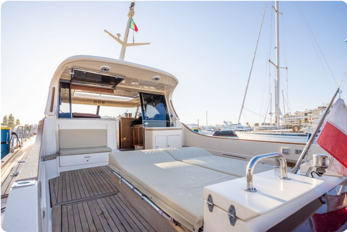
Dolphin 51 cockpit