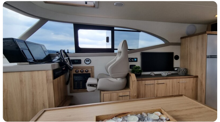
Monachus 45 SC 11