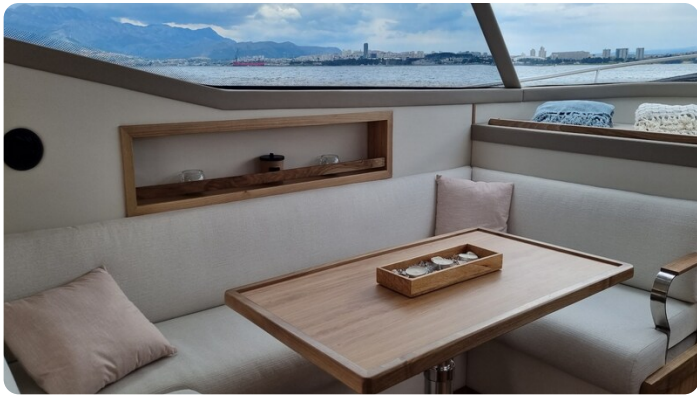
Monachus 45 SC 8