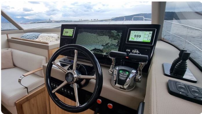
Monachus 45 SC 12