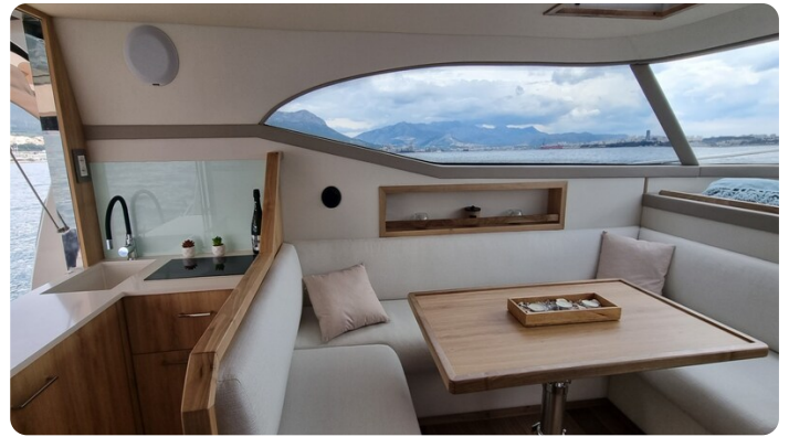
Monachus 45 SC 9