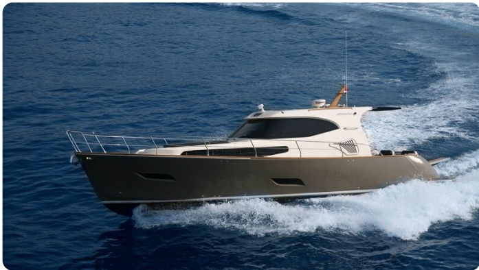
Monachus 45 SC 4