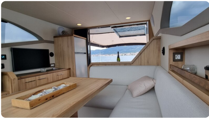
Monachus 45 SC 10