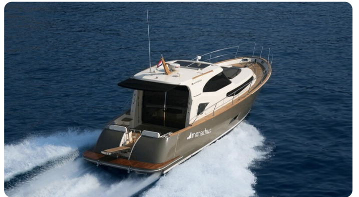
Monachus 45 SC 5