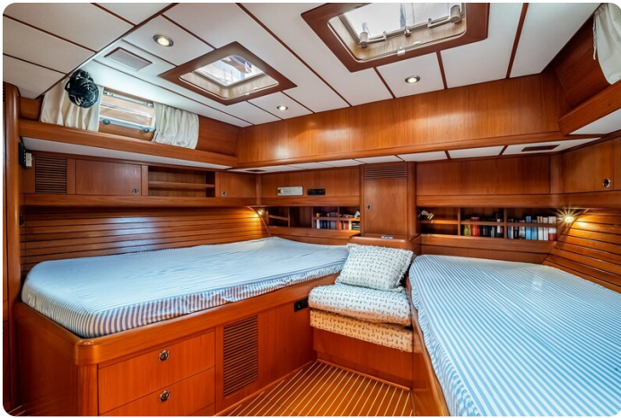
Indigo - Palma -31