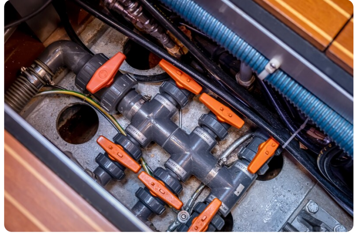
Indigo - Palma -48