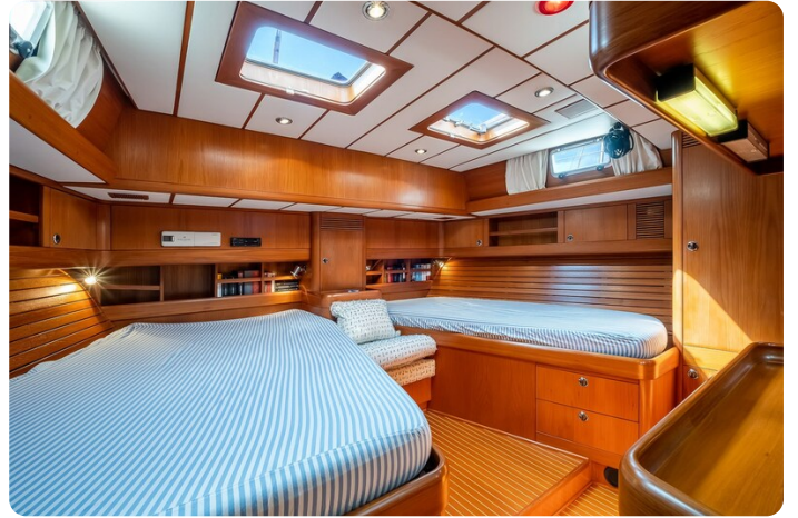
Indigo - Palma -34