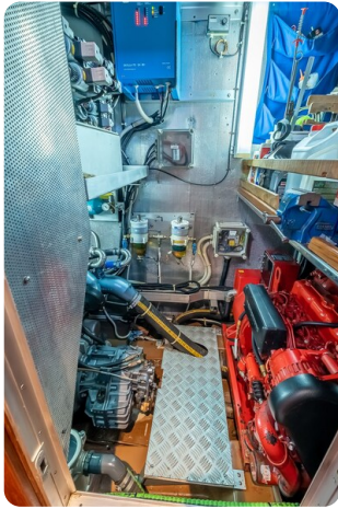
Indigo - Palma -35