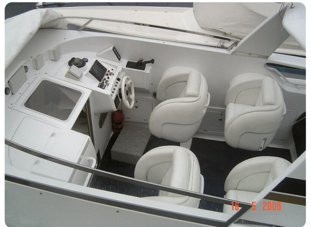
Monte Carlo 17