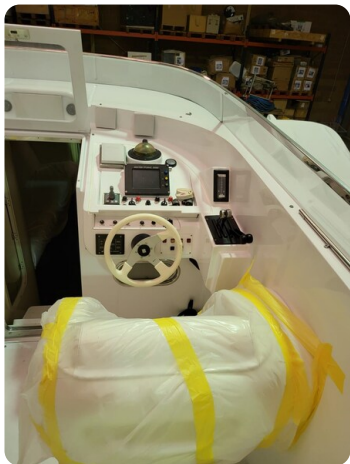
Monte Carlo 1