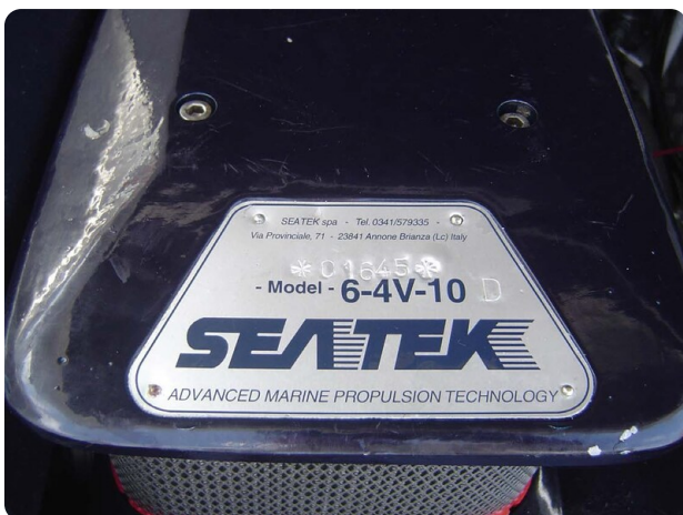
Monte Carlo 17