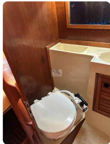
Avance 36 dL msp21