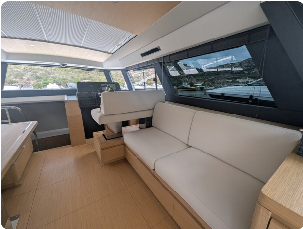
{1} Salon lounge