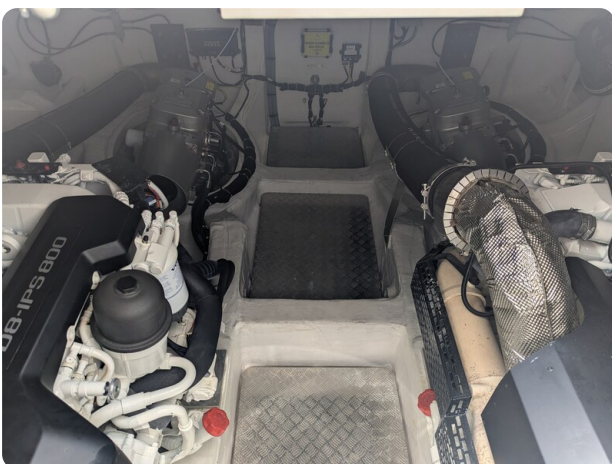
{1} Engine room