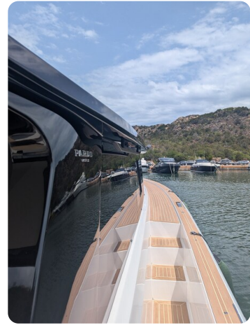
Pardo GT52 sideway