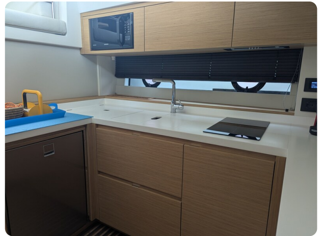
{1} Galley detail