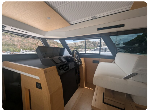
Pardo GT52 helm station