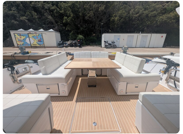
Pardo GT52 cockpit dinette convertible