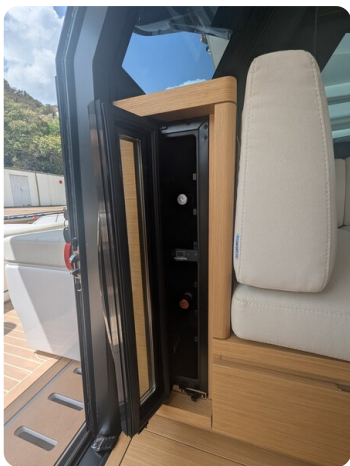
Pardo GT52 wine cooler