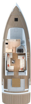
Pardo GT52 main deck