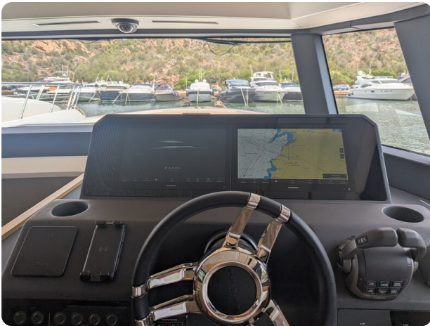
Pardo GT52 helm detail