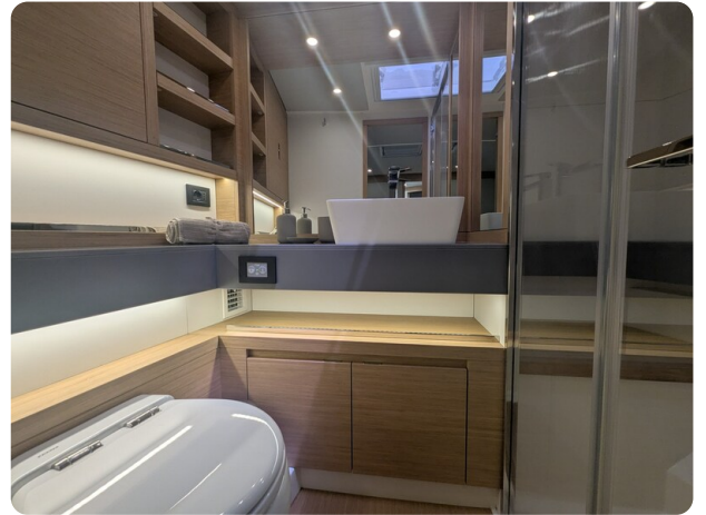
Pardo GT52 owner's bathroom