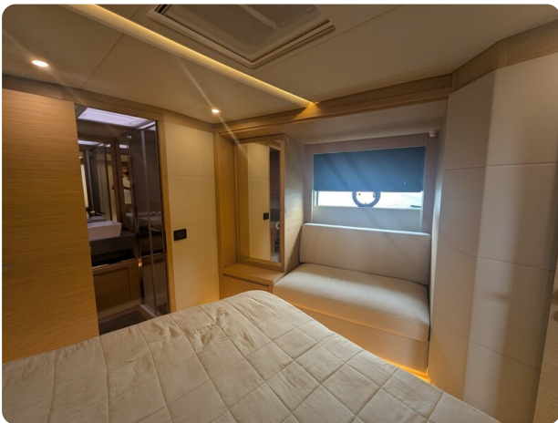
{1} Owner's cabin detail