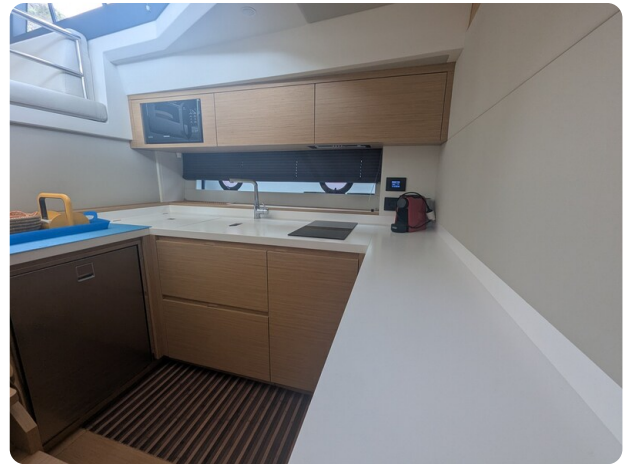
Pardo GT52 galley view