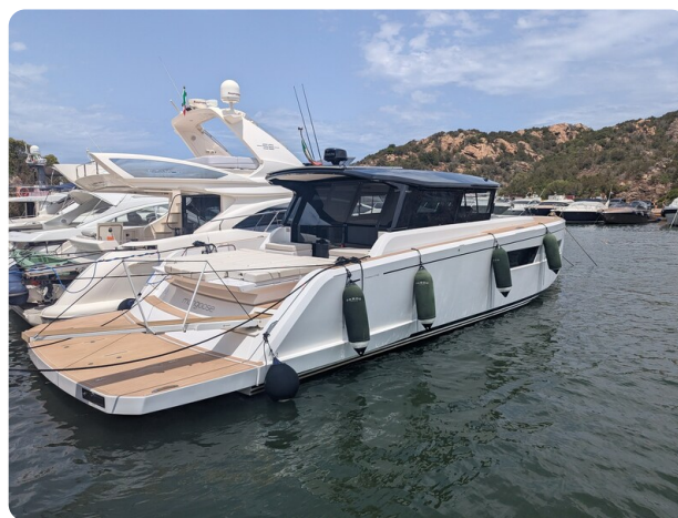
Pardo GT52 aft profile