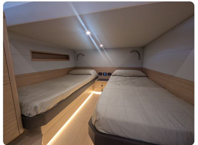
{1} Guest cabin