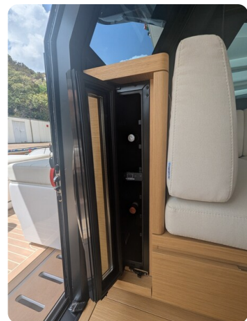
Pardo GT52 wine cooler