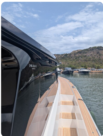
Pardo GT52 sideways