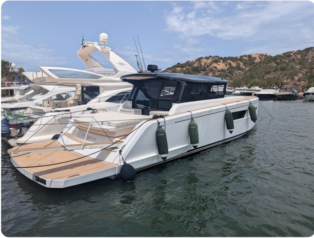
Pardo GT52 aft profile