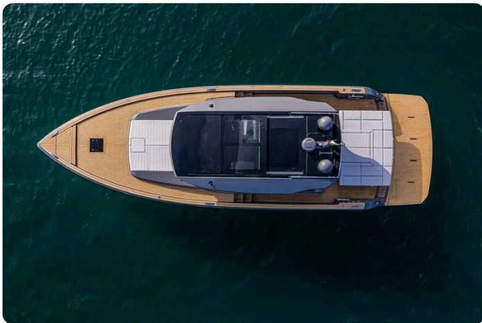
Pardo GT52 aerial view