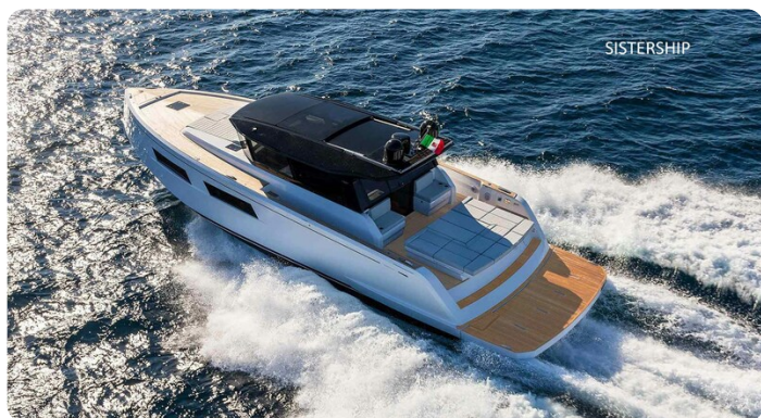
Pardo GT52 sistership