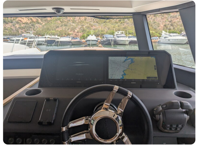
Pardo GT52 helm detail