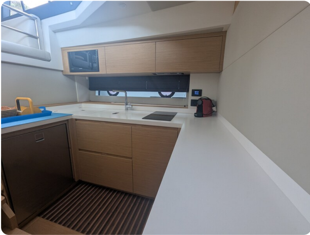
Pardo GT52 galley view