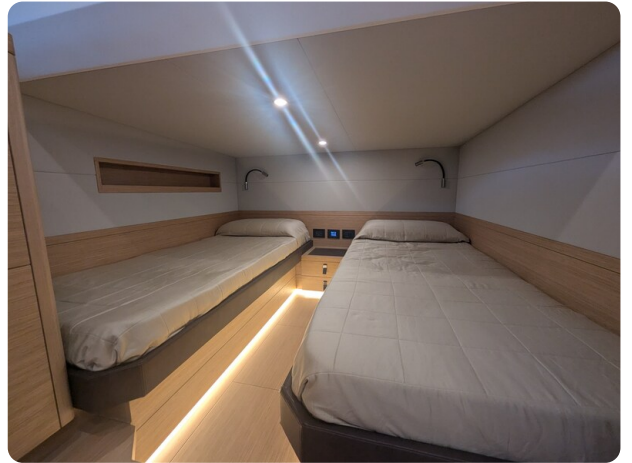
{1} Guest cabin