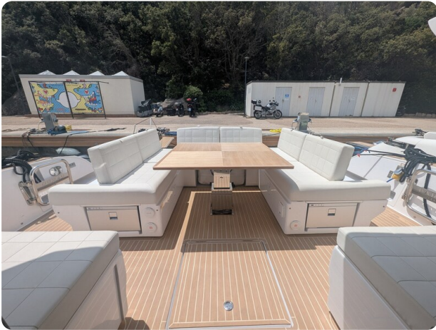
Pardo GT52 cockpit dinette convertible