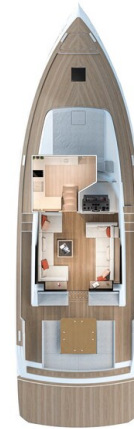
Pardo GT52 main deck