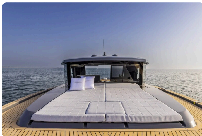
Pardo GT52 bow sunpad