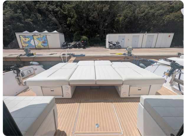
Pardo GT52 aft sunpad