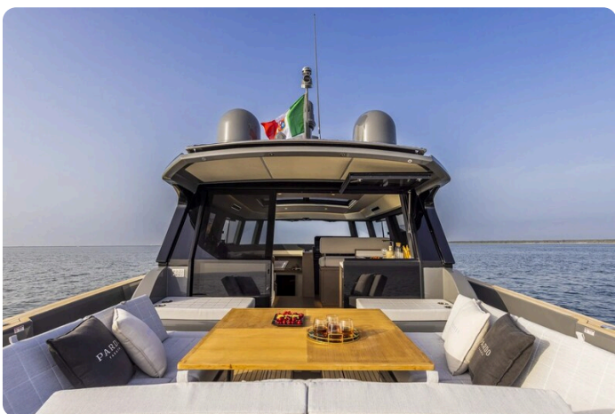
Pardo GT52 cockpit view