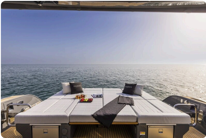
Pardo GT52 aft sunpad