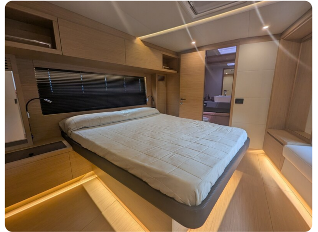
Pardo GT52 owner's cabin