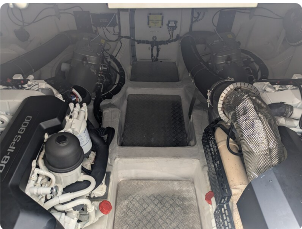
{1} Engine room