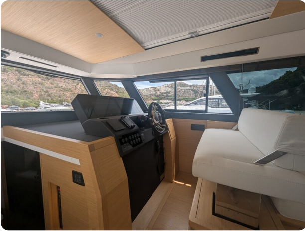
Pardo GT52 helm station