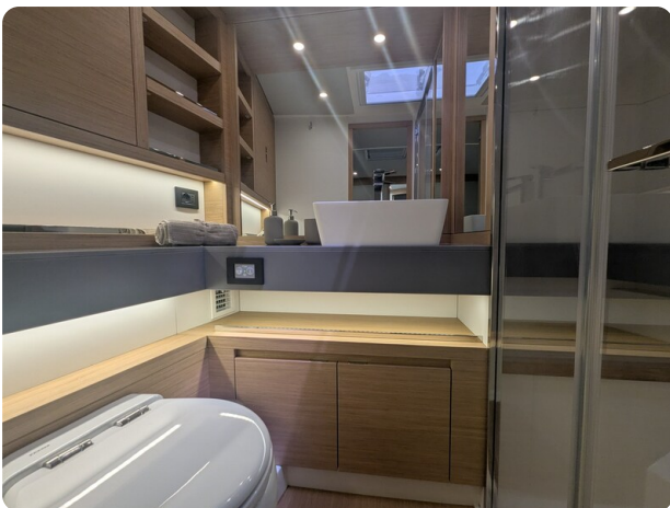
Pardo GT52 owner's bathroom