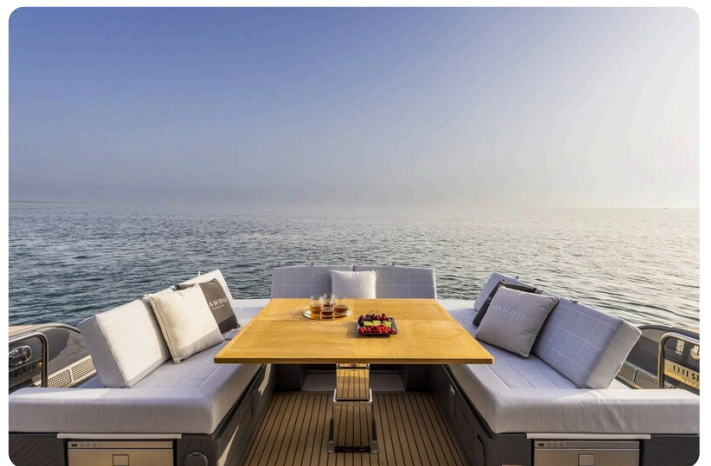
Pardo GT52 cockpit dinette