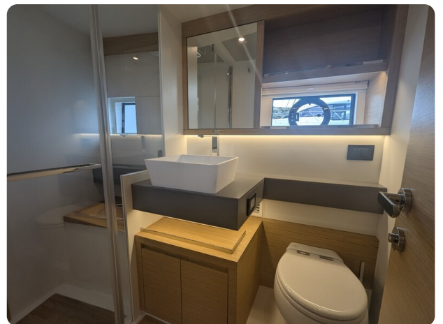
Pardo GT52 guest bathroom