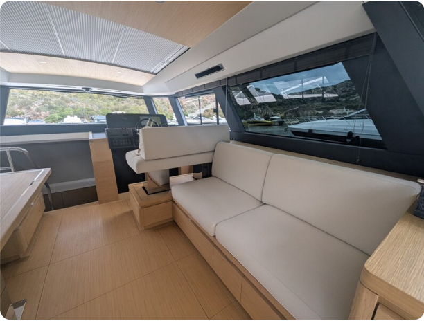
{1} Salon lounge