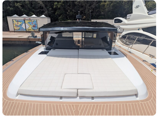
Pardo GT52 fwd deck with sunpad