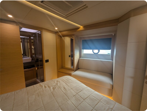
{1} Owner's cabin detail