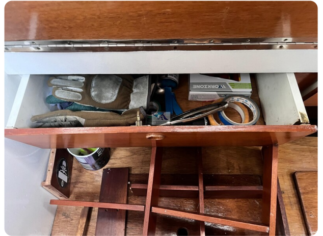
Grinde msp 790164 49