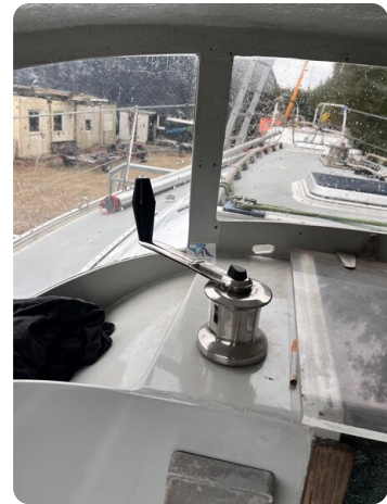
Grinde msp 790164 37