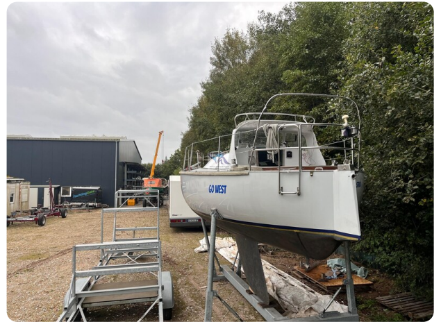
Grinde msp 790164 32