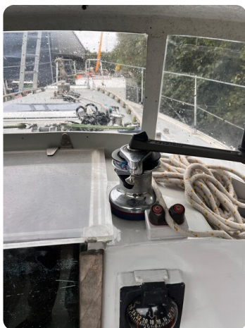
Grinde msp 790164 56