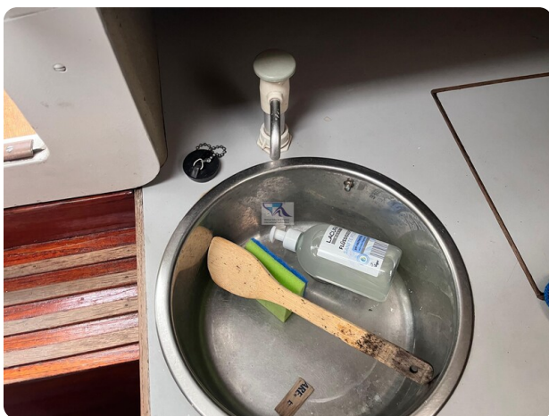
Grinde msp 790164 27