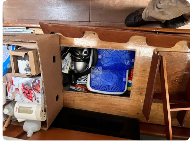
Grinde msp 790164 38