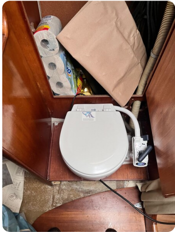
Grinde msp 790164 48