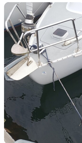
Grinde msp 790164 130