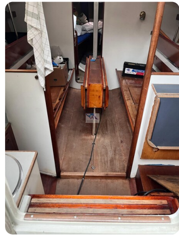
Grinde msp 790164 23