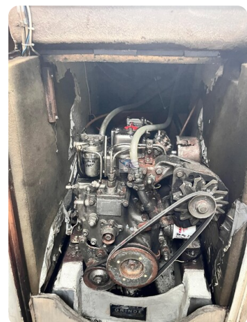
Grinde msp 790164 59