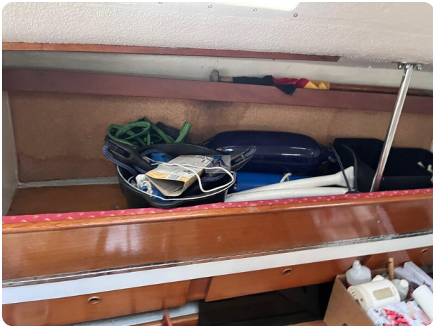
Grinde msp 790164 36