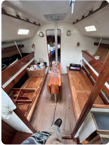
Grinde msp 790164 31