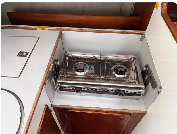
Grinde msp 790164 43