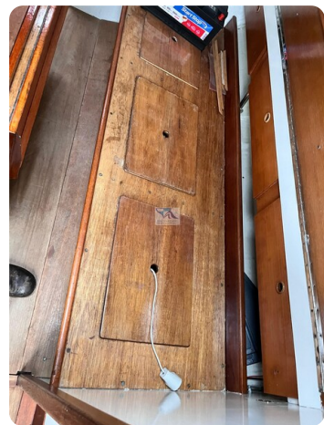
Grinde msp 790164 33