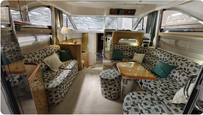
Princess 420 ARNO 1