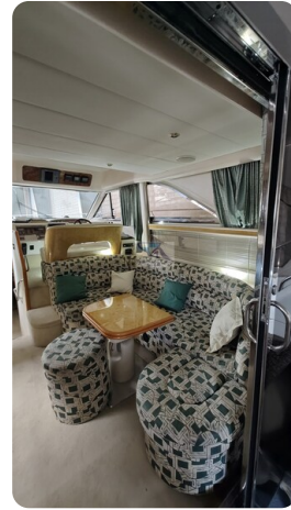
Princess 420 ARNO 3