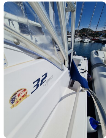
Proline 32 Express, side view