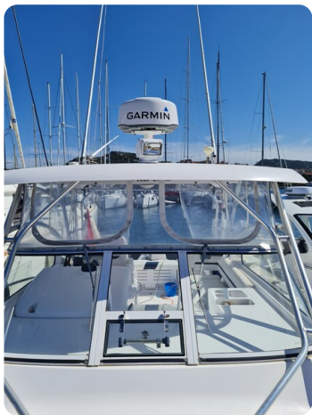
Proline 32 Express, Hard Top detail