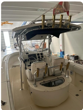
Pursuit C310 T Top