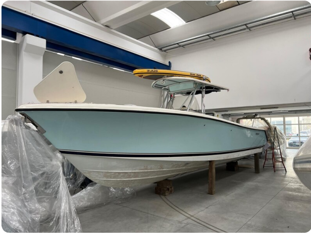
Pursuit C310 bow profile