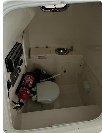
Pursuit C310 head