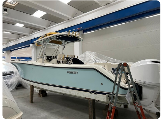
Pursuit C310 aft profile