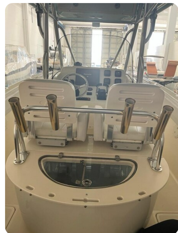
Pursuit C310 live baitwell