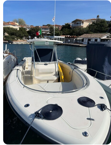
Pursuit C310 bow view