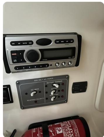
Pursuit C310 stereo system