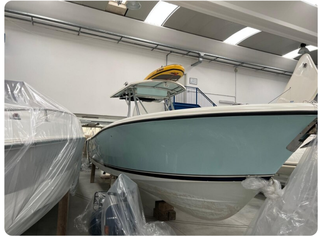
Pursuit C310 bow