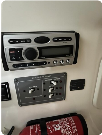
Pursuit C310 details