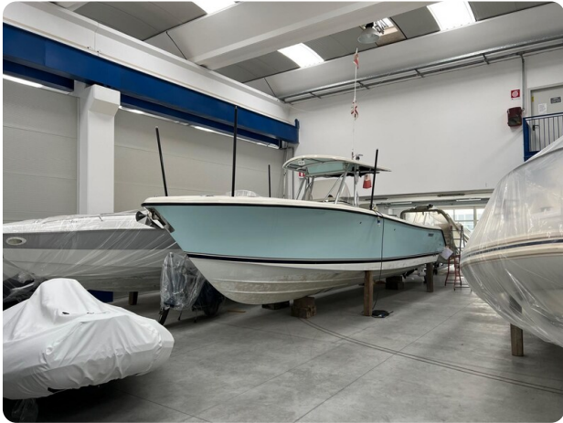
Pursuit C310 view