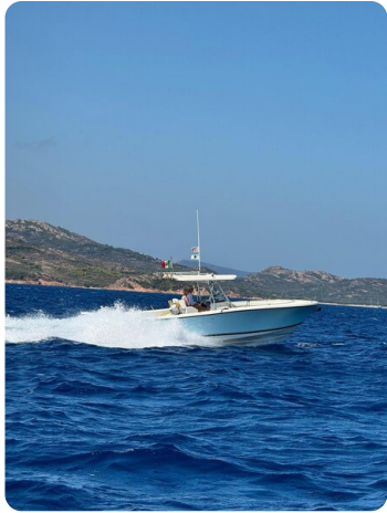
Pursuit C310 running