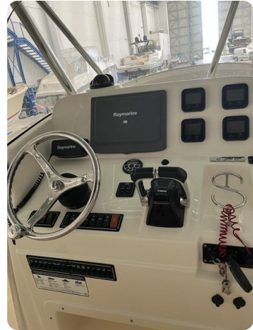
Pursuit C310 helm