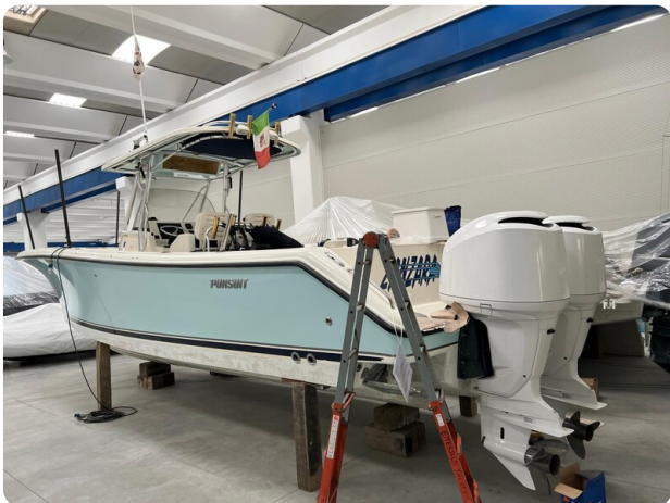
Pursuit C310 engines