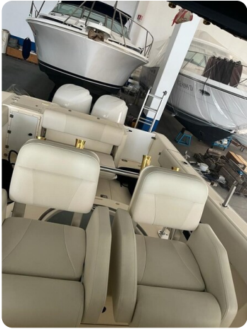
Pursuit C310 cockpit detail