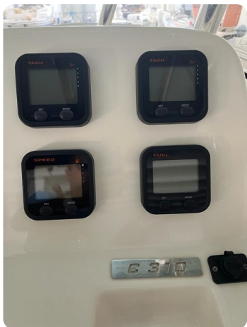
Pursuit C310 helm detail